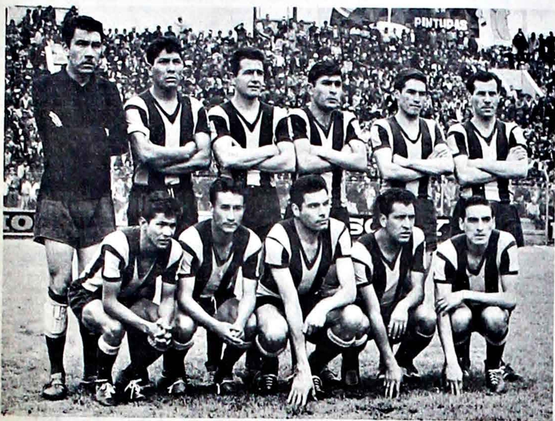
ESTE es el equipo que ayer presentó The Strongest para su difícil encuentro frente a Municipal. Muchos de ellos perdieron la calma y se desempeñaron bruscamente. El conjunto "atigrado" logró el sub campeón de torneo de Primera "A" luego de una buena campaña.