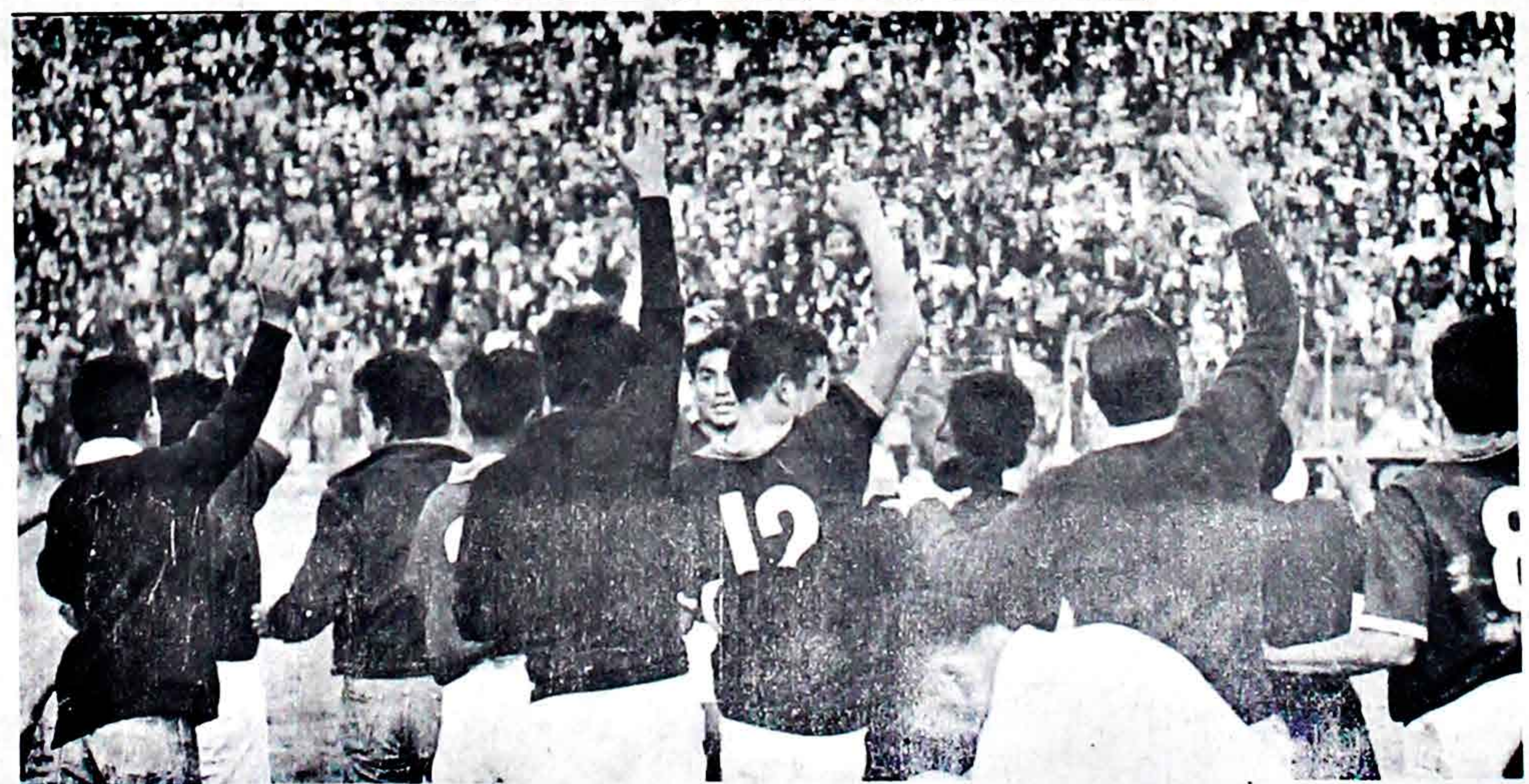
LOS INTEGRANTES de Municipal saludan al público luego de empatar con Strongest y de esa manera conseguir el título de 1965. Hubo júbilo por la victoria que fue conseguida en un encuentro brusco, donde la mayoría de los integrantes de uno y otro conjunto, fueron en busca del físico del adversario.