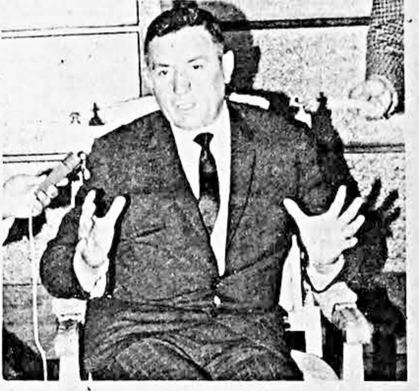
Barrientos: "En Enero y Febrero habrán desórdenes organizados por los demagogos. Estos serán arrojados de inmediato del país".

Al finalizar la reunión, pronunció un discurso el general Barrientos, quien anunció que entre Enero y Febrero del próximo año habrán desórdenes organizados por los demagogos, vagos y malentendidos. "Estos brotes - agregó - serán reprimidos con severidad". Refiriéndose al aumento de salarios sin incremento de producción Barrientos manifestó que se trata de repetir un nuevo 21 de Julio, señalando que quienes promueven huelgas o desórdenes serán arrojados de inmediato del país.