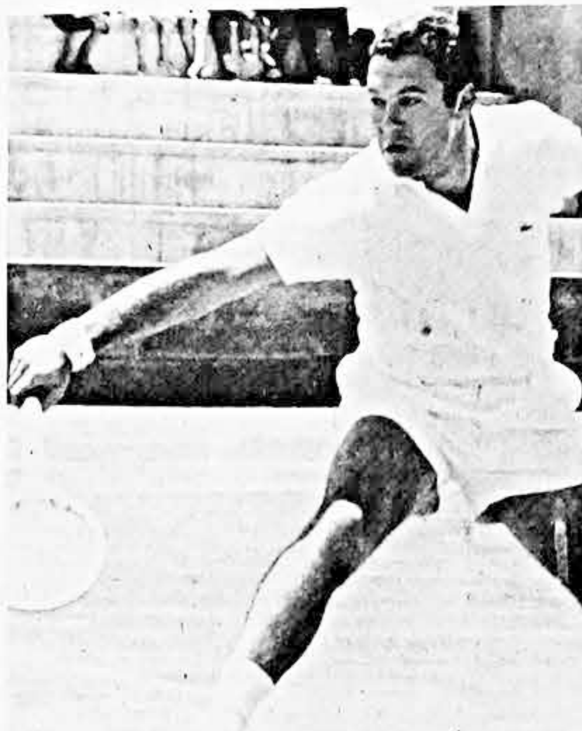
GRAN FIGURA.- Nicola Pietrangeli demostró en el torneo internacional que finalizó ayer, las condiciones que lo destacaron en los torneos más famosos del mundo. Se trata de una gran figura.