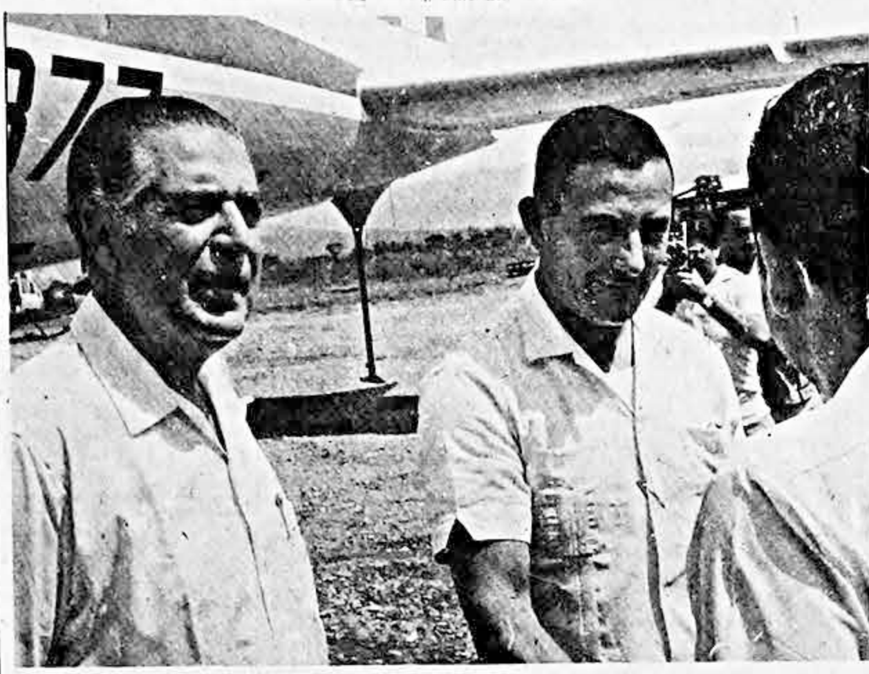
En la población de Tarapoto, avanzada de la civilización en la selva amazónica, el Presidente Barrientos recibe el saludo de las autoridades locales. A su lado aparece el Presidente Belaúnde, ambos juntos al DC-6B del Presidente peruano, que el sábado recogió al mandatario boliviano de El Alto y ayer lo dejó en La Paz.