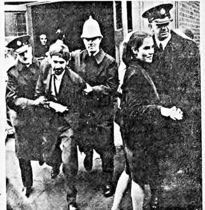
La policía saca de una iglesia metodista de Brighton, Inglaterra, a un hombre y a una mujer, cuando se produjo un incidente en ella a raíz de que el Primer Ministro Harold Wilson ocupó el púlpito para leer una lección sagrada. Gritos de protesta produjeron entonces el incidente en el que tuvo que intervenir la policía. Wilson estaba en esa ciudad para participar en las deliberaciones de la convención del partido laborista

Los cinco diputados, todos miembros del Movimiento Democrático Brasileño, de oposición hablaron en la primera sesión de la Cámara después de ser destituidos el miércoles.