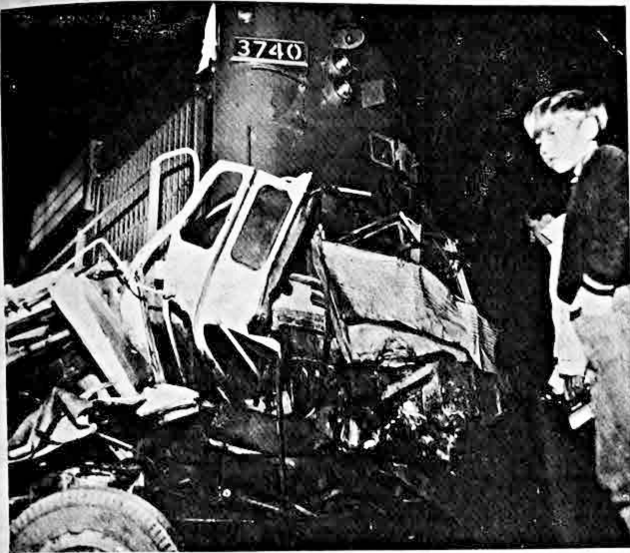
Un total de 19 personas resultaron muertas, casi todos adolescentes, cuando el autobús en el que viajaban chocó con un tren de carga cerca de Dorion, Quebec, Canadá. Partes del autobús se pueden apreciar en la fotografía, delante del tren. El accidente sucedió la semana pasada