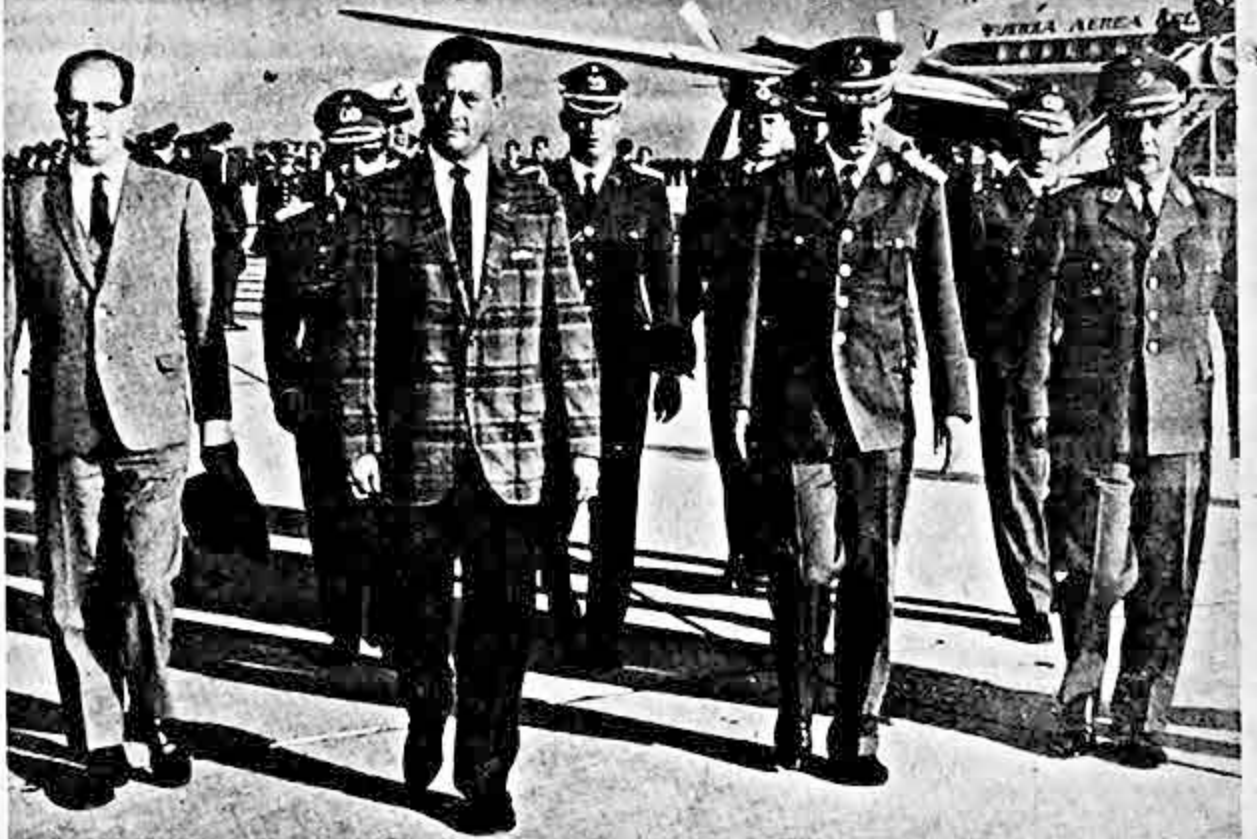
Poco después de arribar a El Alto, ayer, el Presidente Barrientos, junto al Vicepresidente Siles Salinas, al Comandante en Jefe de las FF.AA., Gral. Ovando, otros autoridades, pasó revista a los efectivos militares que le rindieron los honores de ordenanza al desembarcar del avión que lo trajo del Perú.

Quito, 17 (AP).- Las fuerzas derechistas dominaron ampliamente las elecciones de diputados constituyentes de ayer, y obtuvieron por lo menos 33 de las 67 bancas disponibles, según los primeros resultados conocidos. Los comicios, que se efectuaron normalmente, contaron con el sufragio de un 65 por ciento de los electores, considerándose este porcentaje como satisfactorio para una elección plural. La mayor abstención fue de mujeres, quienes en otras ocasiones han participado activamente en los actos electorales. El potencial electoral era de 1.038.000 ciudadanos. Los derechistas triunfaron en las diez provincias del altiplano, en tres de las cuatro de la selva oriental y alcanzaron significativa representación en las cinco provincias anticosteñas de la costa. El Liberalismo, después de muchos años, demostró vigor en Quito, y parece haber obtenido 18 bancas para convertirse así en el eje del bloque antiderchista. Otros diputados fueron elegidos por los grupos minoritarios, que también pueden constituirse en factor determinante en la Asamblea. Los derechistas cuentan con cuatro diputados funcionales de los 12 que se designaron indirectamente. Las elecciones de ayer han sido consideradas como el primer paso seguro que da el Ecuador para comenzar una nueva época política para restablecimiento del orden legal, que se completará con la instalación de la Asamblea, el próximo tres de noviembre.