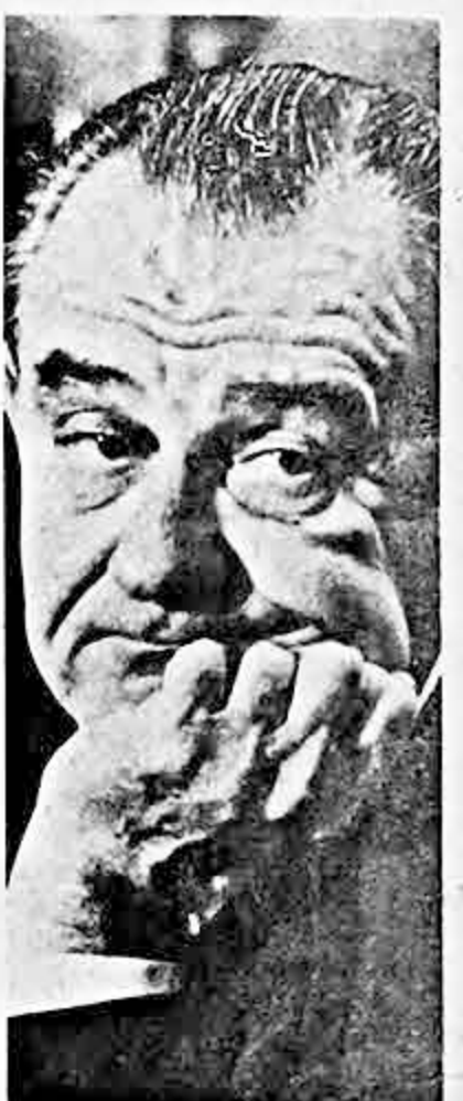
Un viaje de 14.000 kilómetros por el Lejano Oriente inició ayer el Presidente Johnson, cuya preocupación por abrir puertos a negociaciones de paz en Vietnam podrá concretarse en hechos a través de su conferencia con 7 gobernantes asiáticos.