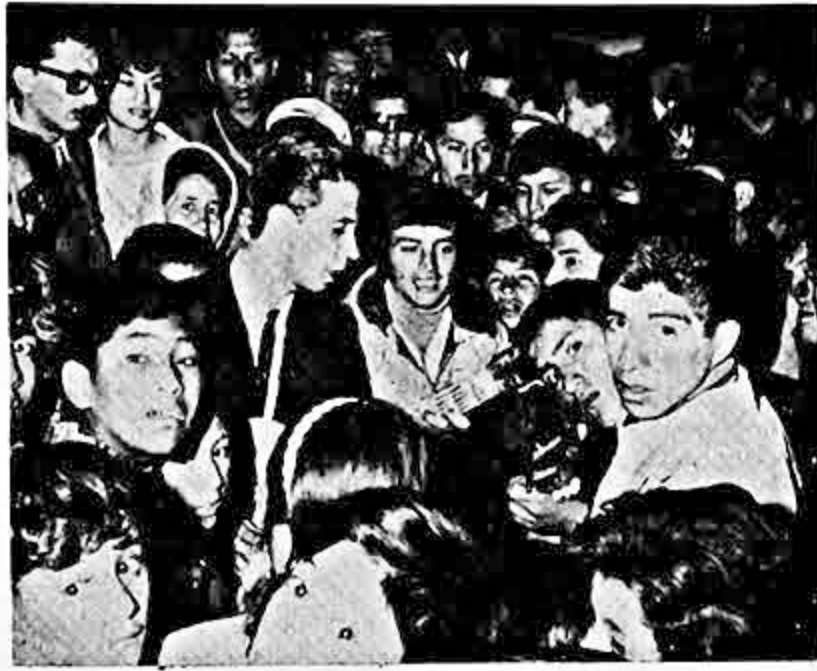
"Bingo en Domingo", programa de "Presencia" y "Radio Méndez" destacó el domingo pasado a varios conjuntos musicales o distintos barrios de la ciudad complaciendo pedidos de serenata. En el gráfico aparece uno de los conjuntos rodeado de numeroso público de la calle Antonio Gallardo, donde se había hecho presente atendiendo uno de los numerosos pedidos.

La muestra estará abierta al público hasta el 4 de noviembre.