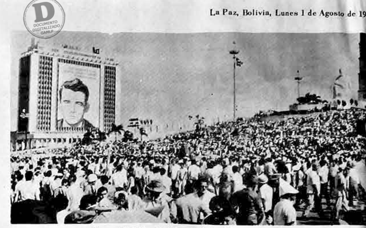
Una multitud llena la Plaza de la Revolución de La Habana, el 26 de julio, al celebrarse el 13º aniversario del estallido de la revolución castrista. A la izquierda, el Ministerio de Defensa sostiene un enorme retrato de Abel Santamaría, héroe revolucionario

NACIONES UNIDAS, 31 (AP) - Los grupos de naciones latinoamericanas y africanas rivalizan por una posición clave en la Asamblea General de las Naciones Unidas para el trimestre de la vigésima primera sesión, que comenzará el mes de septiembre. Cada grupo respalda a su propio candidato para la presidencia de la comisión política de la Asamblea -los latinoamericanos al Embajador Leopoldo Benítez, del Ecuador, y los africanos al Embajador Achkar Marof, de Guinea.