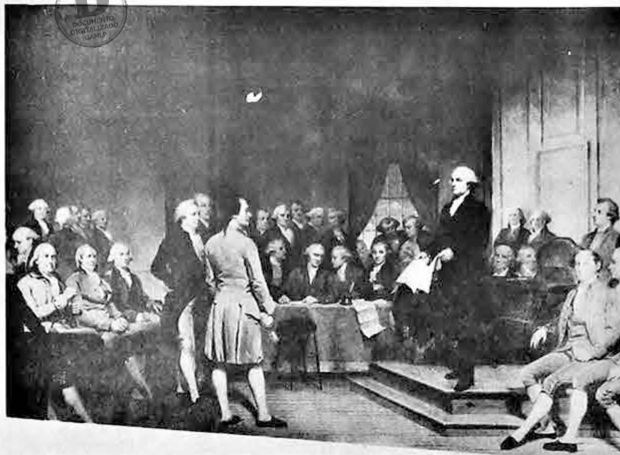
"Washington se dirige a la Convención Constitucionalista" cuadro de J. Bruto Stearns, que se exhibe en el Museo de Bellos Artes de Virginia. Aparecen en él los miembros del Congreso Continental que adoptaron y firmaron la Declaración de la Independencia, el 4 de Julio de 1776.

Algunos eruditos afirman que la declaración francesa no fue redactada tomando como modelo el documento de Jefferson sino la Declaración de Derechos de Virginia, escrita por George Mason en junio de 1776. Pero ese análisis no opaca el punto principal: Que el ejemplo norteamericano fue una fuerza altamente influyente en la declaración francesa.