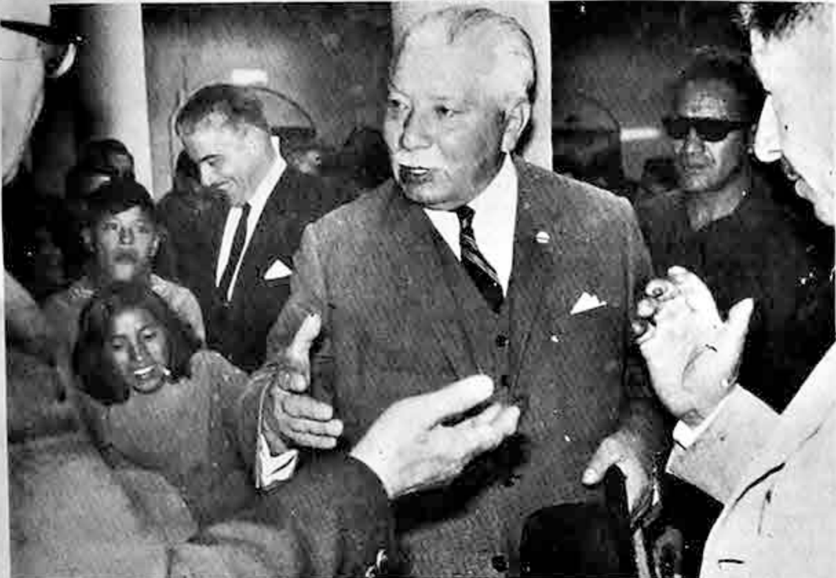
El prestigio del Gral. Bernardino Bilbao Rioja fue ayer puesto a prueba. La fotografía muestra una escena que se repitió a lo largo del recorrido que hizo por las diferentes zonas de la ciudad constantemente aplaudido, extendió la mano para retribuir el saludo de centenares de personas que se disputaban para estrechar la suya.

En ambiente de orden y tranquilidad, salvo aislados incidentes en La Paz, se desarrolló ayer la elección que dio el triunfo a la candidatura del Gral. René Barrientos Ortuño. En todo el país según informó el Ministerio de Gobierno, hubo normalidad y orden en el proceso electoral.