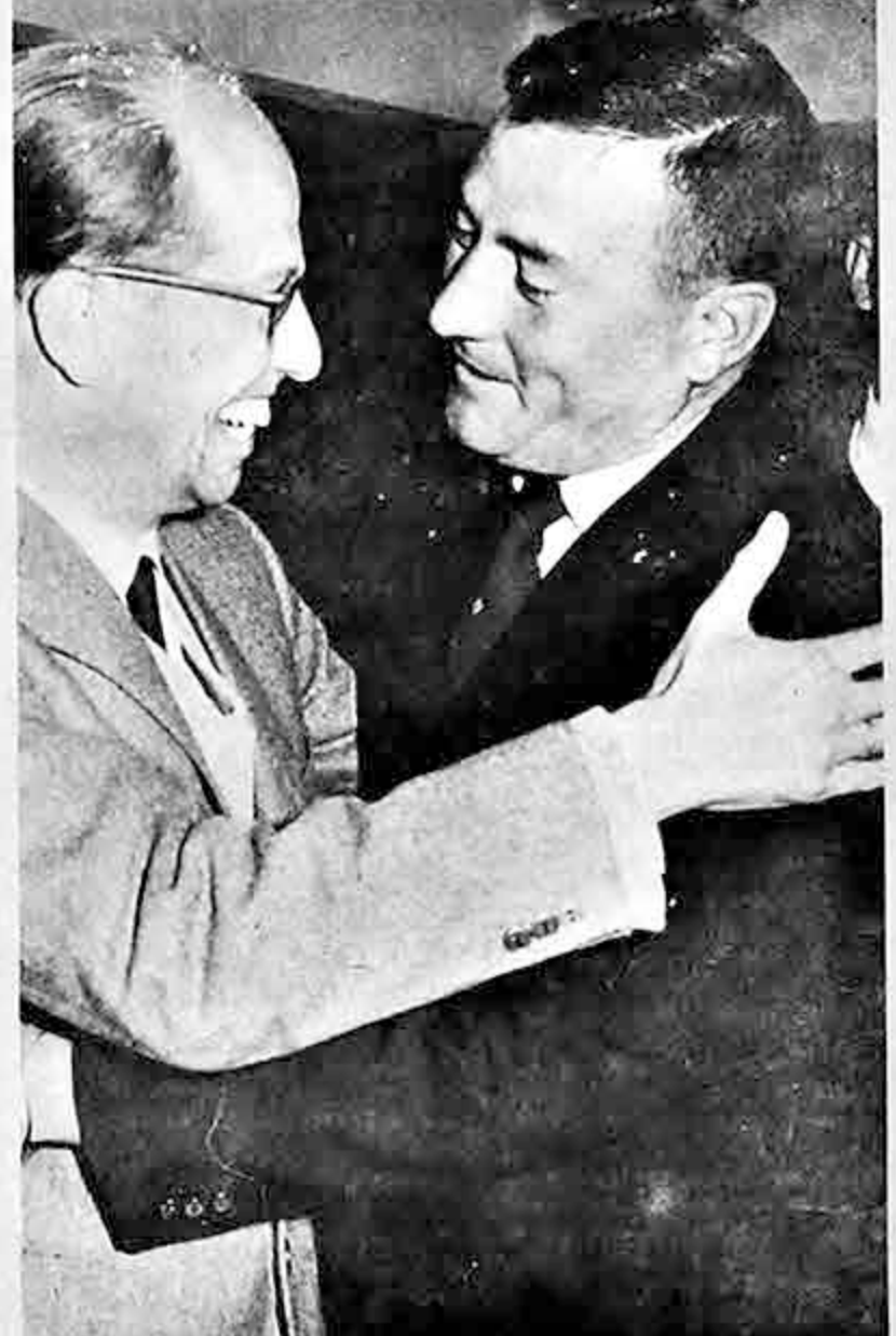
"Quiero ser el primero en darle un abrazo, mi General. Hemos triunfado". Esas fueron las palabras con que Luis Adolfo Siles Salinas comenzó la serie innumerable de abrazos que recibió el Gral. René Barrientos Ortuño, candidato presidencial, minutos después de conocerse los primeros resultados electorales. Fueron necesarios siete disparos de la máquina fotográfica para lograr la presente fotografía, pues el "flash" del fotógrafo se negaba a funcionar.

El Presidente de la Junta Militar de Gobierno, Gral. Alfredo Ovando Candia, cuya aparición en el recinto electoral en que sufragó -Escuela Bancaria en la avenida Arce- sirvió para establecer la popularidad y el aprecio general que ha conquistado en el desempeño de su alto cargo, se constituyó ayer en figura central de la justa electoral. En efecto, en un recorrido por diferentes recintos electorales, se escucharon comentarios favorables sobre su obra de gobierno y, sobre todo, al inquirirse la opinión de los ciudadanos, éstos destacaron el hecho de que el Presidente Ovando había cumplido, como pocos gobernantes, su palabra de realizar elecciones en fecha prevista y bajo excepcionales condiciones de garantías y de libertad.