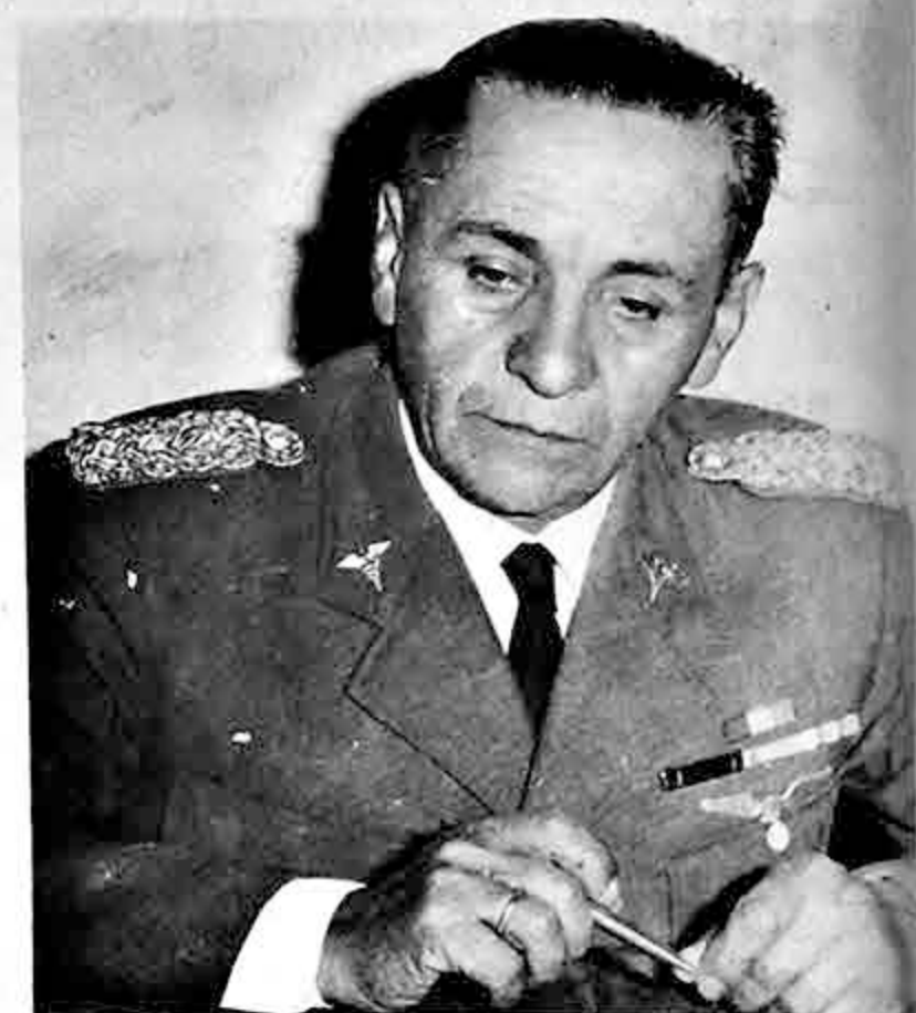
Ministro de Salud Pública Genl. Carlos Ardiles, propulsor del Plan Nacional de Salud.

4. Programa de Inversiones. El programa comprende dos partes: 1. Reequipamiento de los servicios de salud del Ministerio, 2. Exten-