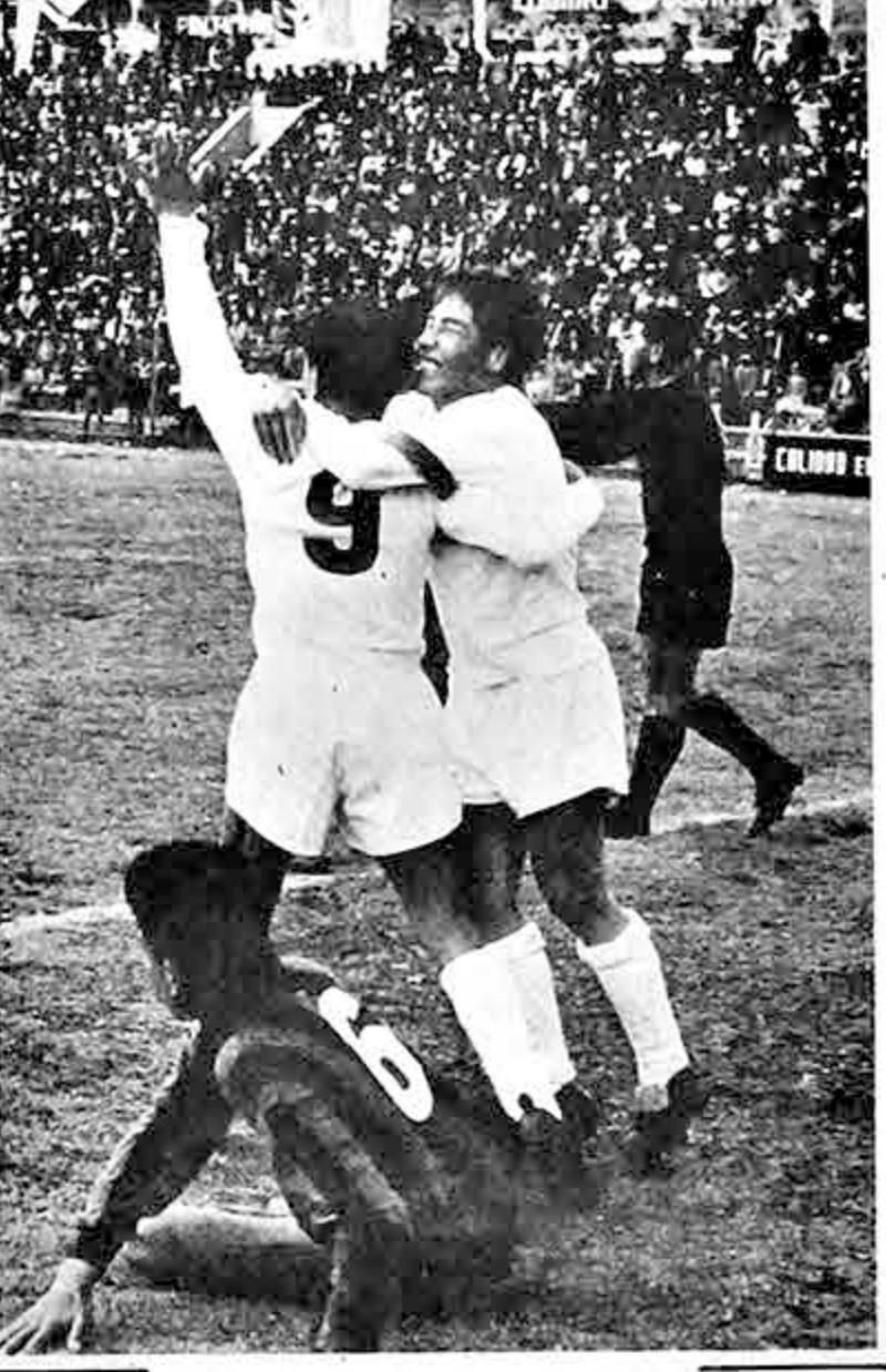
GOL DE "31" Centro de Quintero, tras rápida acción golpe de cabeza de Gutiérrez y segundo gol de 31 de Octubre consolidando la victoria de los albos. Júbilo tras la conquista.