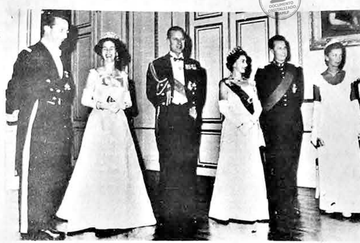
Personajes de la realeza asistieron al banquete ofrecido en Bruselas por los reyes belgas, con el fin de estrechar vínculos entre las naciones europeas. La fotografía muestra al rey Balduino (segundo de la derecha) y la reina Fabiola (segunda de la izquierda), de Bélgica, que fueron los huéspedes; la reina inglesa Isabel II (tercera de la derecha) y su esposo, el príncipe Felipe (tercera de la izquierda). Los príncipes belgas Alberto (extrema izquierda) y Paula (extrema derecha).