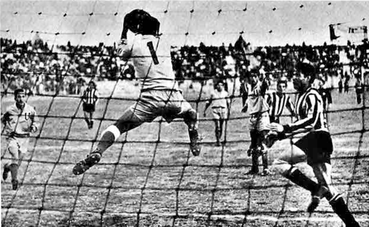
DETIENE TORRICO.- El arquero suplente de Universitario contiene un remate sobre su arco mientras queda anulado el paraguayo. González. Strongest jugó mejor cuando fueron expulsados Díaz y Vargas.