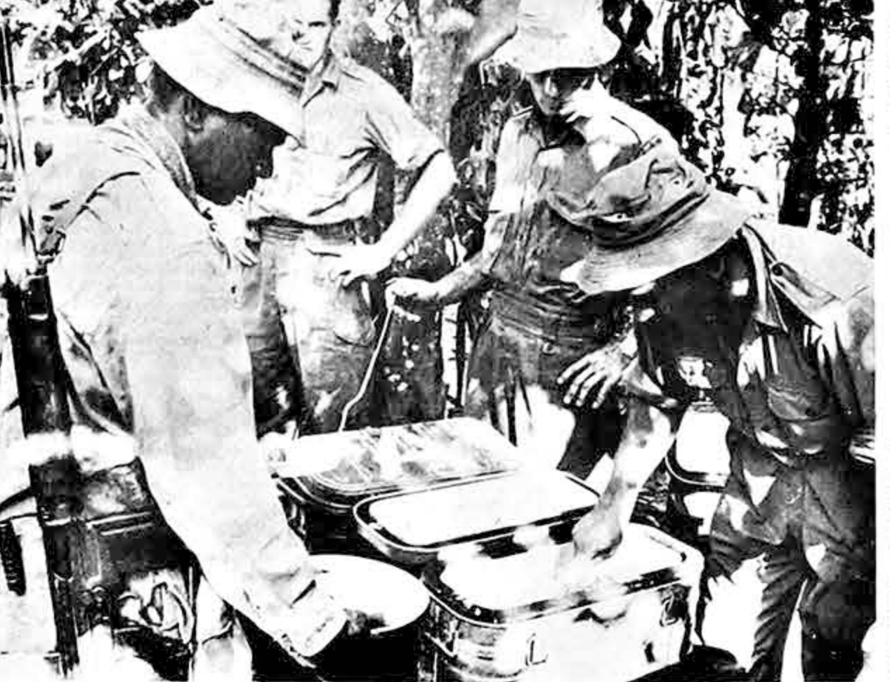
Después de la operación militar y de los sacrificios que ella implica, vienen los momentos de descanso y restauración de fuerzas. La fotografía muestra a un soldado australiano que participó en la operación contra la zona de líneas y fortificaciones del Viet Cong acerca de Saigón. El soldado se acerca a una cocina donde se preparó alimento caliente. La cocina estaba cerca de la zona de combate.

El comunicado aliado sólo señaló que el fin de semana los Infantes de Marina terminaron en la mañana de ayer, una operación después de seis días de persecución al Vietcong en la península de Batagan, 36 kilómetros al sur de Chu Lai. 50 guerrilleros fueron muertos, 6 hechos prisioneros y se capturaron 14 armas, dijo el comunicado.