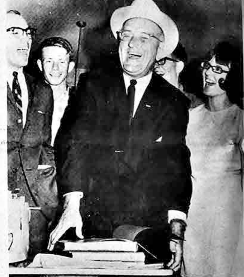
El Presidente Johnson efectuó una visita sentimental a la Universidad donde cursó sus estudios. Mientras visitaba la universidad, situada en San Marcos, Texas, alguien le mostró una copia del anuario de 1929 donde había una foto suya. Al verse el Presidente no pudo contener su risa

El personal técnico de la estación, junto con los técnicos del Proyecto de Mejoramiento de Cultivos Andinos hicieron de instructores en la exhibición de ganado ovino y llamas. Es un programa auspiciado por la Organización de las Naciones Unidas para la Agricultura y la Alimentación.