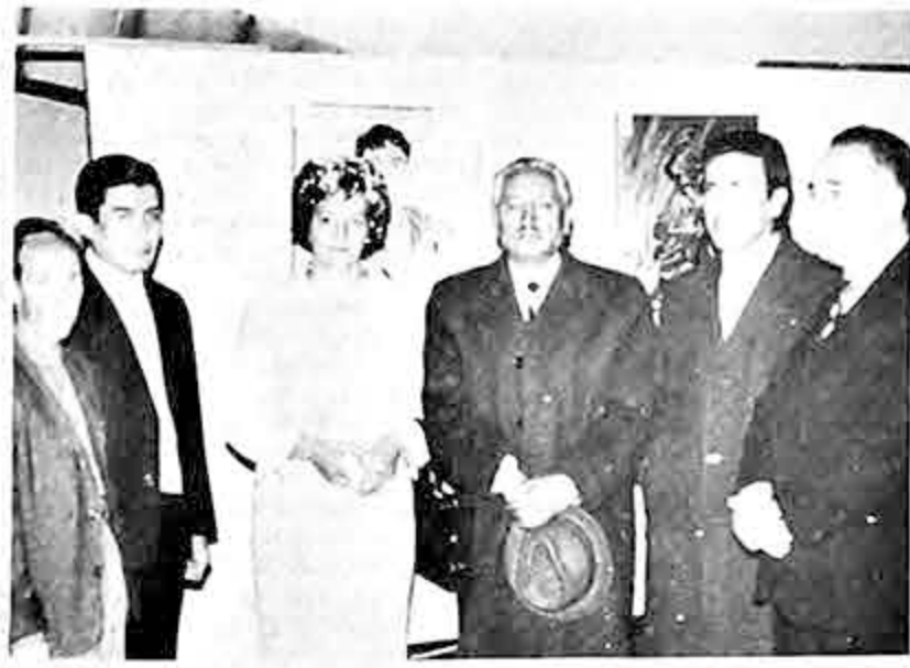
Durante la inauguración del V Salón Pictórico de la Amistad en la Universidad "Tomas Frías" de Potosí, la Primera Dama de la Nación, posa con el Rector y cuatro destacados pintores.