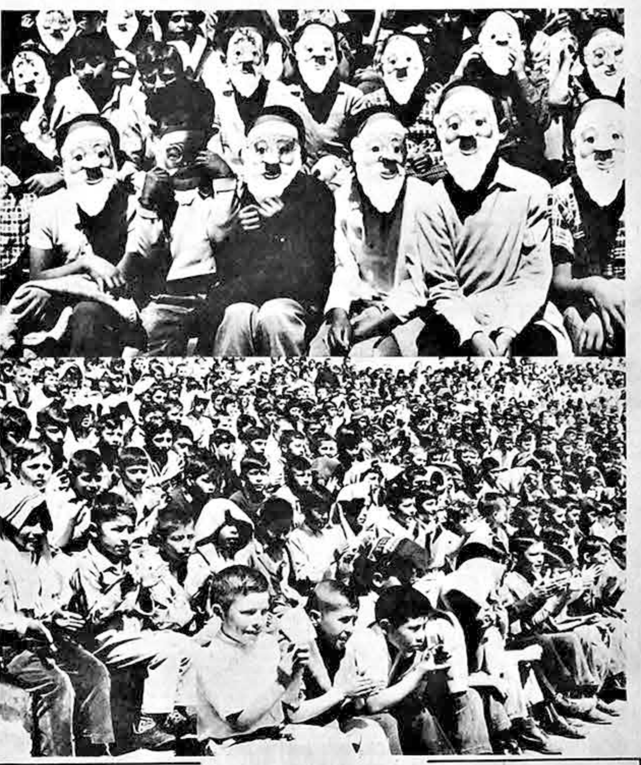
Doña Elsa Omiste de Ovando repartió juguetes a los niños congregados en el festival que, en honor a ellos, se realizó ayer al mediodía en el Teatro al Aire Libre ‘Jaime Laredo’, de La Paz. En la foto superior se observa a un grupo de niños portando máscaras repartidas por la esposa del Presidente. Abajo, una fracción de la concurrencia infantil.

Es probable que Falange, en esa oportunidad, después de una misa en memoria de sus muertos, salga en manifestación a las calles para expresar su repudio al régimen del MNR. Esa manifestación concluirá en el Cementerio, ante la tumba de Ungaza.