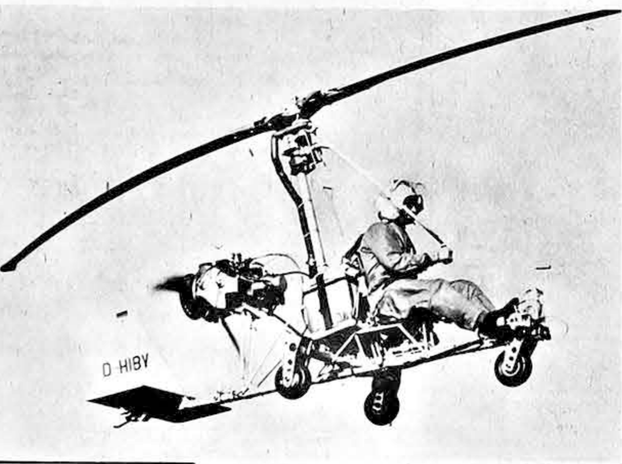
UN NUEVO tipo de helicóptero ha sido presentado en la República Federal de Alemania. Con este aparato experimental se pretende estudiar hasta qué extremo pueden ponerse en práctica las ventajas que ofrece este tipo de construcción. A diferencia del helicóptero corriente se propulsa el nuevo modelo por accionamiento en las puntas de las hojas del rotor.

Los alemanes, según confirma un periódico de Bonn, se han dirigido preferentemente a Italia Suiza, Francia, Austria y Holanda. Los franceses reciben gran número de ingleses y los suizos a los italianos. Al margen de este flujo turístico, ya sea en automóviles y otros medios de comunicación de carácter privado, hay el que las agencias de viajes organizan en forma colectiva. Enormes autobuses transportan hacia los lugares de atracción un gran número de pasajeros y los barcos han dirigido sus proas hacia las Islas Griegas o al Medio Oriente. También los habitantes de cada nación han querido conocer primero sus respectivos países, París, Bonn, Roma, Zurich, Londres y Viena están llenas de "provincianos" que visitan a su capital. Este gran flujo turístico, con gran movimiento de vehículos también, crea problemas a las autoridades policíacas y aduaneras. Las primeras deben controlar que el reglamento caminero se mantenga y agilizar el tráfico que en los puntos fronterizos se detiene por horas y donde los automóviles forman columnas de cuatro, cinco y más kilómetros. ¿Quién gana? Indudablemente todos los hoteles, los negocios, restaurantes, estaciones de servicio, en una palabra, todo aquel que participa en un círculo económico vinculado al turismo. No se puede decir que existen grandes diferencias entre uno y otro país, ya que el turismo en Europa ha llegado realmente a una verdadera integración.