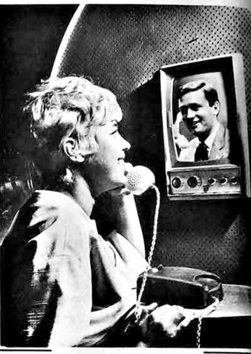
EL TELEFONO.- televisado fue una gran atracción en la Exposición Industrial de Alemania, en Berlín. De esa manera se ha mostrado públicamente un invento que tiende a revolucionar las comunicaciones telefónicas.

DAKAR, 9 (INTER PRESS SERVICE).- Cuatro países africanos, los Estados Unidos, Unión Soviética e Italia, se han repartido hasta el momento los premios de la sección cinematográfica del "Primer Festival Mundial de Artes Negras", inaugurado en esta ciudad el 1 de abril. Fueron invitados al certamen de cine 122 films, y además de los países africanos participan Brasil, Estados Unidos, Alemania Federal, Italia, Francia, Gran Bretaña, Checoslovaquia y Unión Soviética. El jurado, presidido por el director nigeriano Edward Horatio y compuesto por la actriz Marpessa Down, el crítico cinematográfico Georges Sadoul, el director y etnólogo Jean Rouch, el crítico italiano Cesare Castello y exponents de la cultura africana, admitió en concurso un total de 22 películas. Dos directores de Senegal -país anfitrión- recibieron el "Antiflope de Plata" para el mejor largo metraje y el mejor corto metraje con argumento, respectivamente. El premio especial del jurado para el estreno de un director africano fue atribuido a Ousmane Sembene (Senegal) y a Diagne Costa (Guinea). El "Antiflope de Plata" para dibujos animados fue compartido por "La Mort Du Gan-