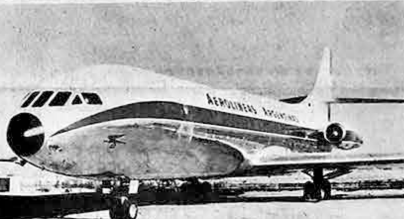
Este es un avión ‘Caravelle’, similar a los que el Gobierno francés ofrece vender, a crédito, al Lloyd Aéreo Boliviano, como resultado de las exitosas gestiones efectuadas por el Canciller de nuestro país, durante la visita que hizo a Francia.

En Temuco, 690 kilómetros al sur de Santiago, y Valdivia, 850 kilómetros al sur, la intensidad registrada fue entre cinco y seis, en la escala internacional con máximo de 12. El temblor duró 15 segundos.