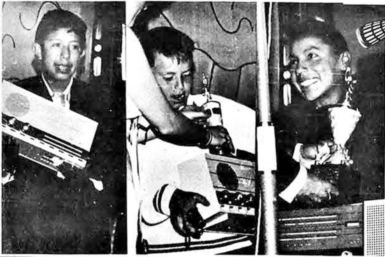
PREMIOS. El sábado en el Show de los Sábados, se procedió a la entrega de premios de la carrera de cochecitos sin motor, que organizó Radio Méndez. El panó permite apreciar aspectos de la entrega de los premios Philips y Coca Cola.