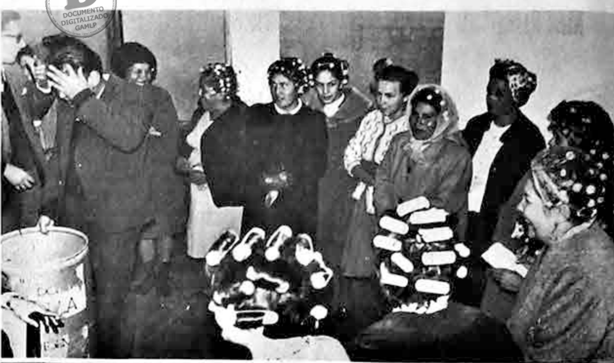
Esta vez fueron los "rulers" y sirvió para evidenciar que las damas, en general, cuando hay un propósito de por medio, no encuentran dificultades ni reparan en aspectos exteriores para salir a la calle como muestra la foto. A la izquierda uno de los que colabora en BINGO EN DOMINGO, aparece sorprendido por la enorme cantidad de señoras y señoritas que se hicieron presentes al llamado de Radio Méndez, para ganar uno de los "cartones".