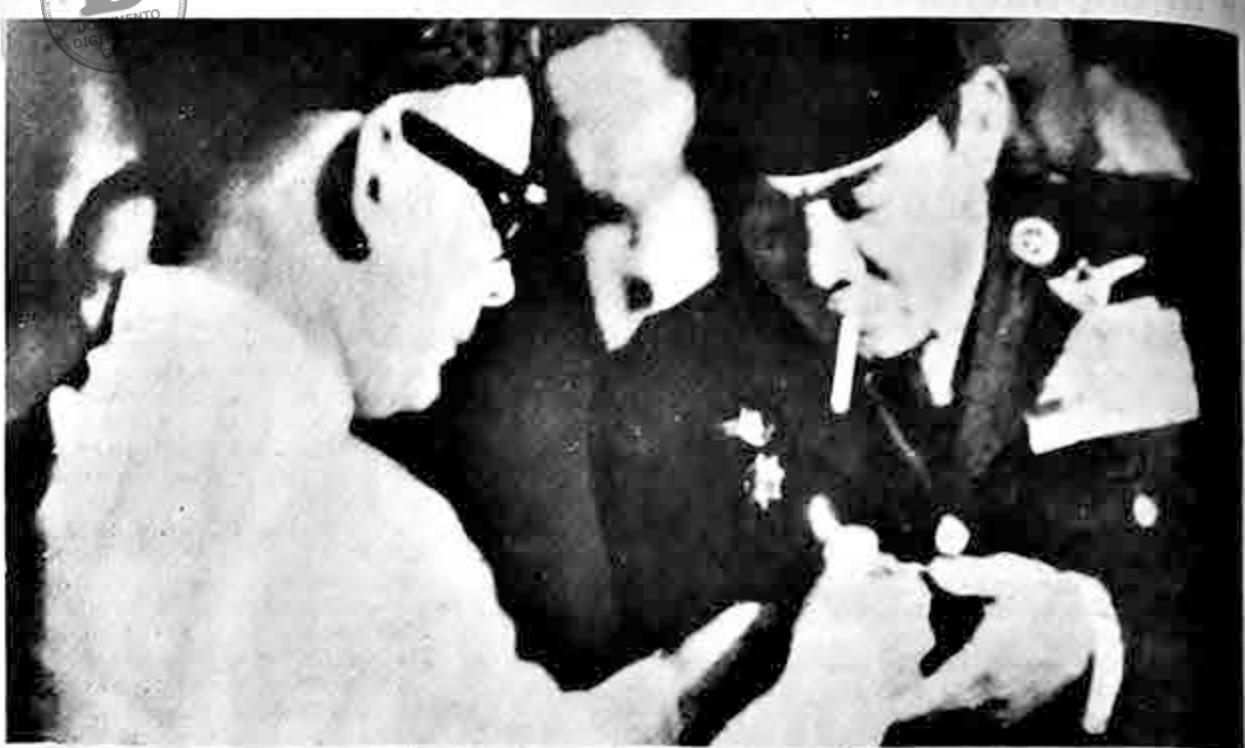
El Presidente Sukarno de Indonesia, aparece por primera vez en público, en una recepción en Jakarta, desde que se iniciaran los problemas de su gobierno y se diera curso a la limpieza de elementos comunistas del mismo. En la fotografía aparece recibiendo fuego para su cigarrillo de manos del embajador de Pakistan Ahsan-Ul-Ruq.

En el sur, chorros de la fuerza aérea incendiaron ayer 34 sampans y tres grandes juncos motorizados, en incursiones sobre el delta de Mekong al sur y al oeste de Saigón, dijo un vocero.