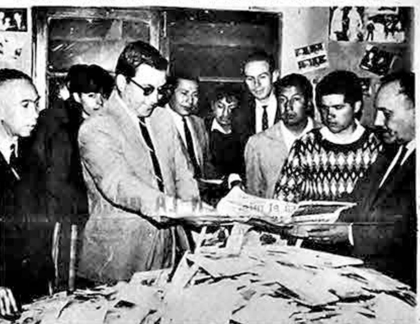
En el momento de realizarse el sorteo de BIBLIOMANIA No 38, una persona del público asistente saca una de las miles de soluciones enviadas por nuestros lectores. Esta papeleta se adjudicó el primer premio de $b 600.