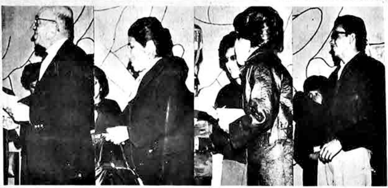
Estos son cuatro de los ganadores del BINGO EN DOMINGO jugado el 20 del presente mes. Los premios al igual que en anteriores oportunidades, fueron entregados en el programa "El Show de los Sábados" de Radio Méndez.