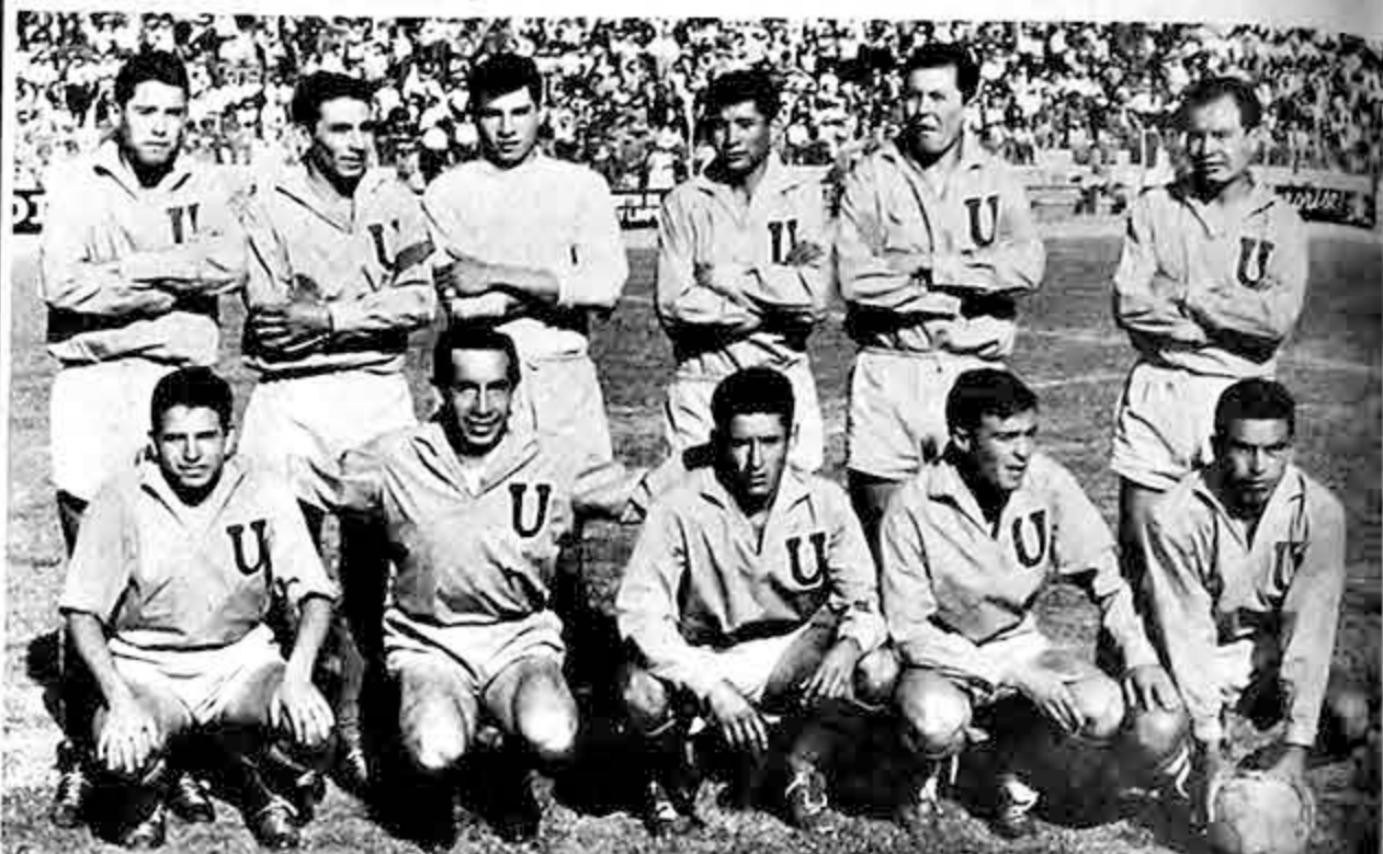
CONTRA STRONGEST. Plantel de Universitario, que actuó en el Apertura, y que el domingo se presentará en el preliminar del festival del CPDB, enfrentando a The Strongest.

El domingo en festival preparado por el Círculo de Periodistas Deportivos de Bolivia, se enfrentarán los equipos de Bolívar y Wilsterman en el cotejo central, y The Strongest contra Universitario en el preliminar.