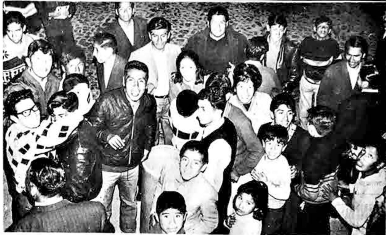
El "bingo de los barrios" da, ahora, posibilidades de que los vecinos de una determinada zona puedan tener oportunidad de ganar uno de los premios de PLASTIX o PHILIPS. En la foto parte del público que acudió a la esquina de la plaza Antofagasta para depositar su "cartón" en el buzón habilitado para el efecto.