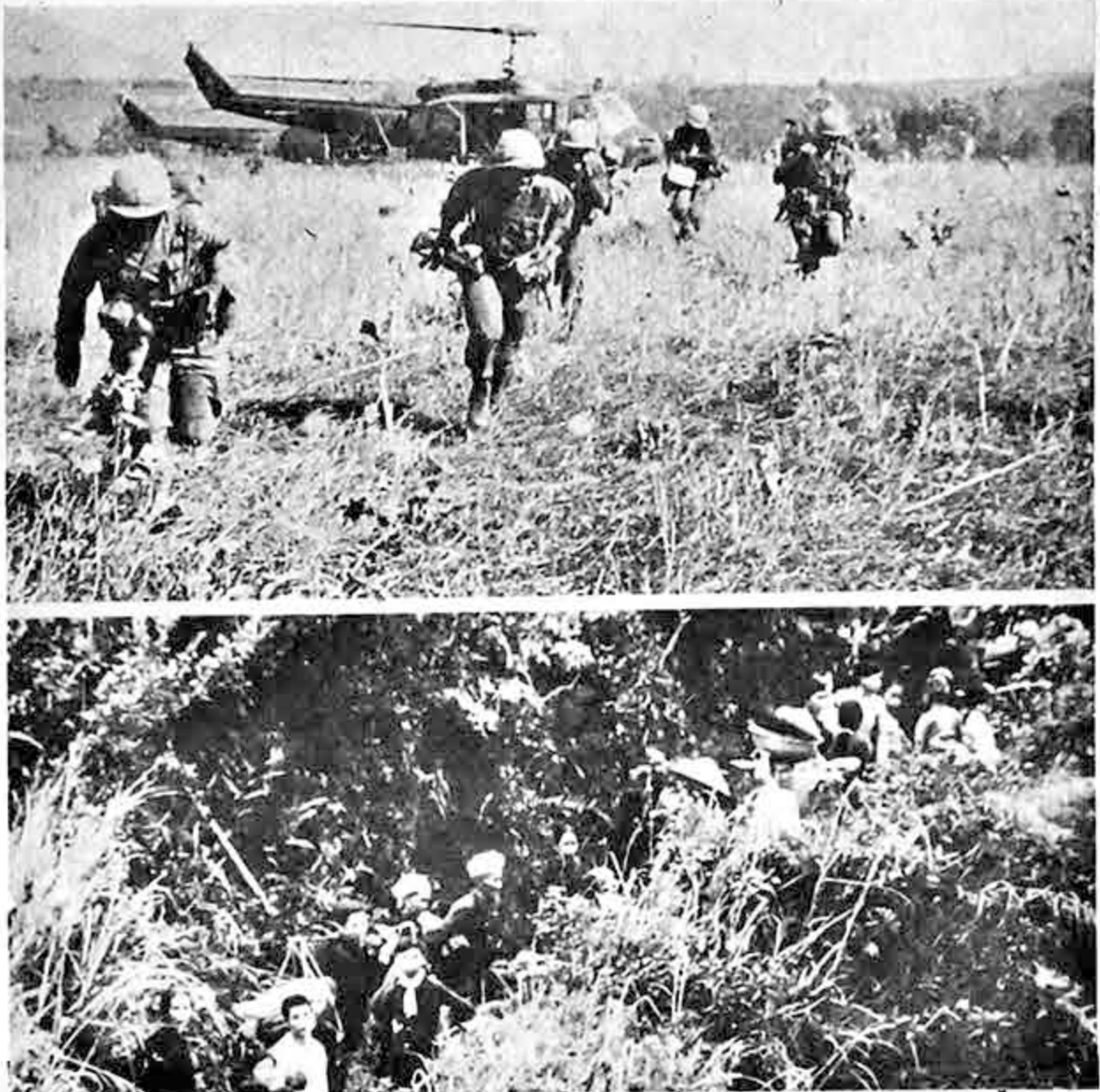
ARRIBA: "Marines" transportados por cuatro escuadrillas de helicópteros se ponen en acción en el campo de operaciones "Doble Águila". ABAJO: Sudvietnamitas abandonan su pueblo situado en pleno centro de operaciones en busca de una zona de seguridad

"Casi 45 millones de personas viven en condiciones de imposible aglomeración, con tres o más personas por pieza, y en unidades (Pasa a la página 7)