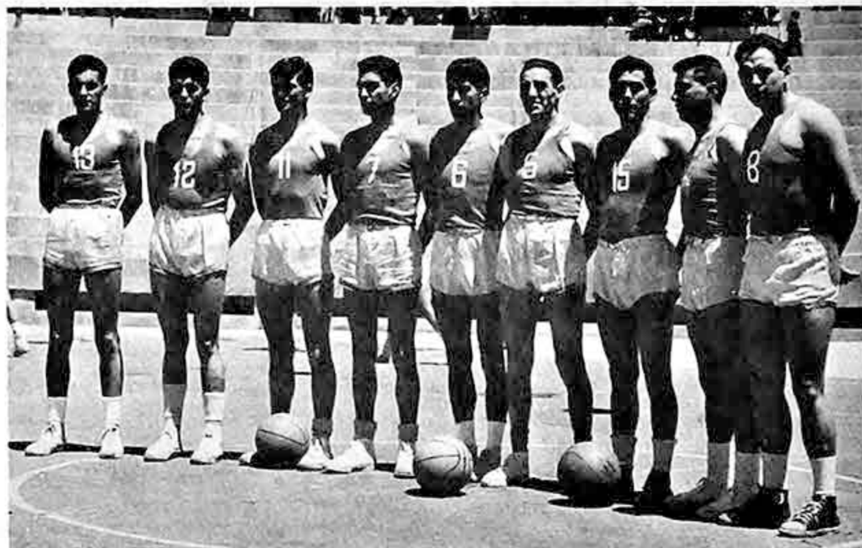
SAN CALIXTO.- Quinteto calixtino que esta noche enfrentará a CAN de la ciudad de Oruro iniciando la breve temporada interdepartamental de basket en el Coliseo.