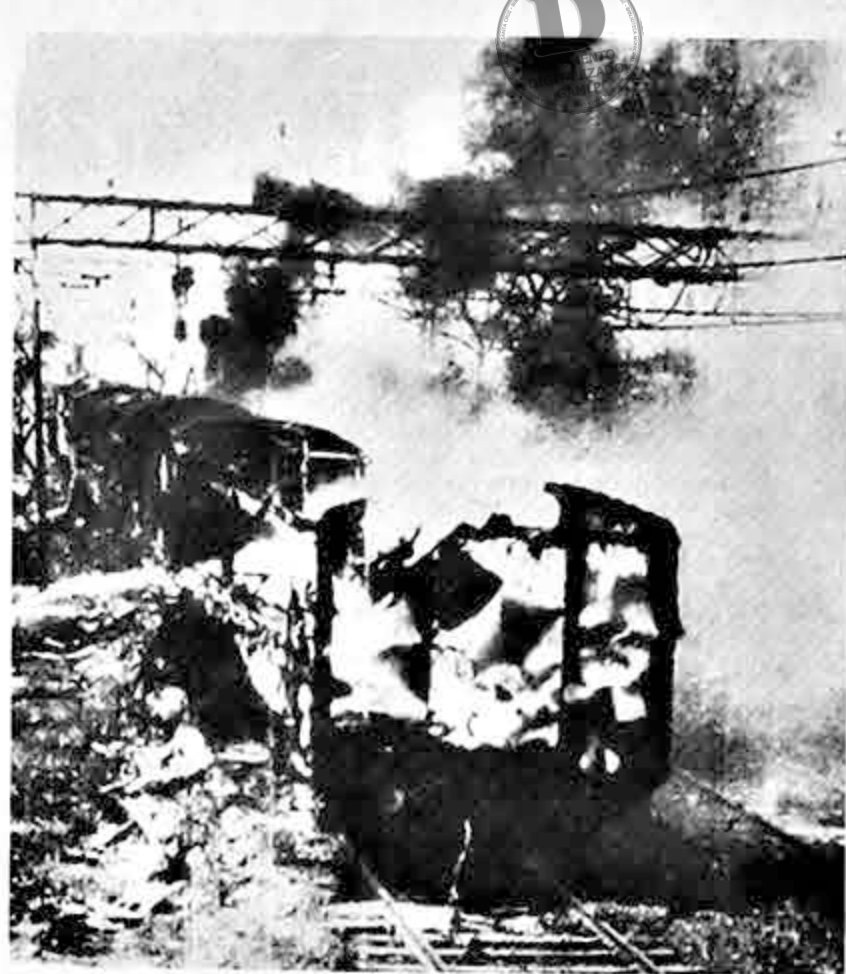
Un vagón ferroviario arde en una estación a 20 kilómetros de Calcuta, después de haber sido incendiado por participantes en la manifestación que reclamaban recientemente por la escasez de alimentos.

Woodward agregó, que según las escasas explicaciones que le daban en el cable, su Gobierno no estaba de acuerdo con lo que se había especificado en dichas normas respecto del comercio internacional. Tampoco, al parecer, estaba de acuerdo con ciertas distinciones que se hacían, en el continente mismo, entre países más desarrollados y menos desarrollados.