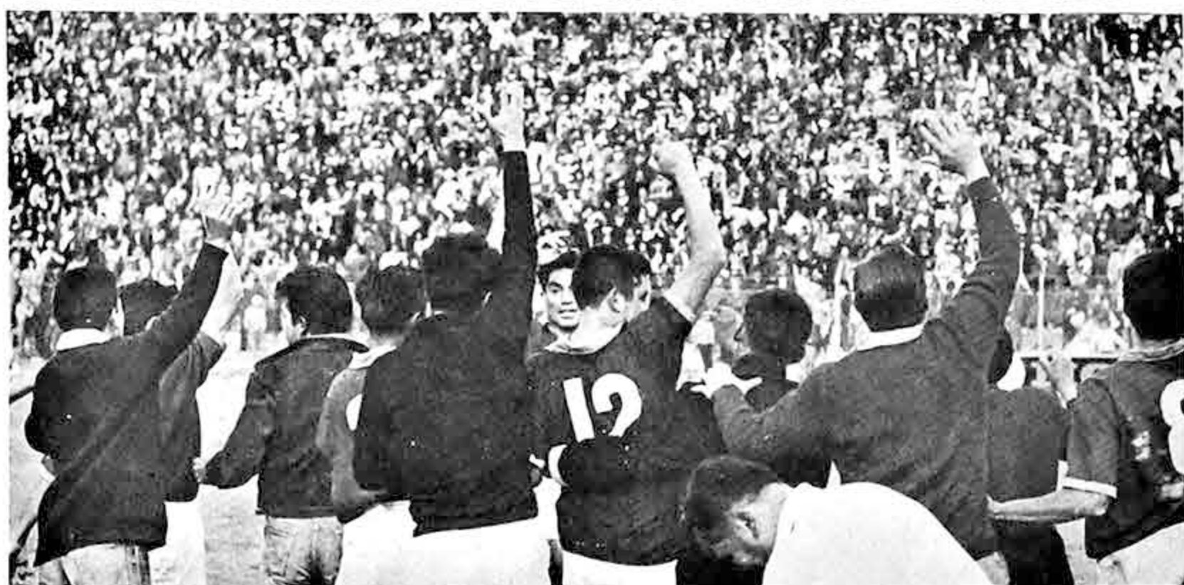
FRENTE A 9 DE OCTUBRE.- Los ediles, enfrentarán esta tarde al elenco sub campeón ecuatoriano, 9 de Octubre en partido correspondiente al certamen "Libertadores de América".

La designación de cabezas de serie se hizo de acuerdo con la clasificación alcanzada en la última olimpiada de Tokio. Luego de las ruedas eliminatorias, los competidores formarán dos grupos: una rueda semifinal para los países que queden ubicados del primero al sexto puesto.