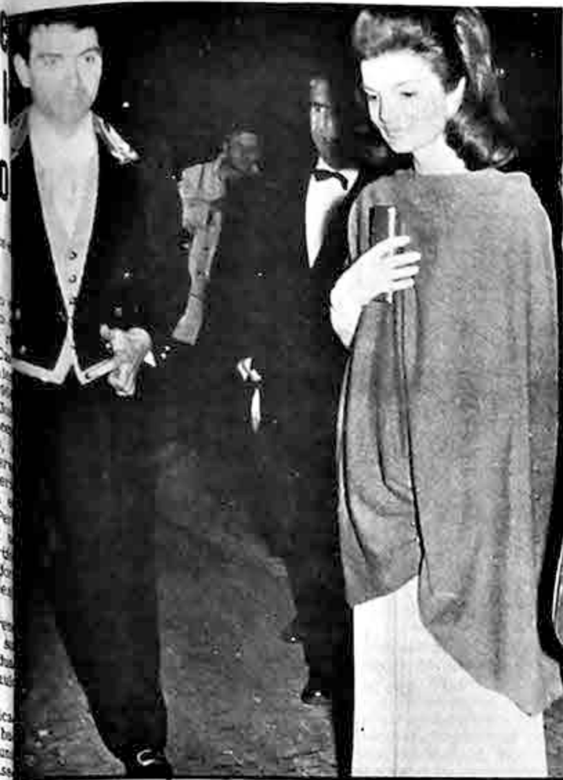
Jackeline Kennedy, luciendo un vestido largo, llega a la fiesta ofrecida en Roma por el Príncipe Aspremo Colonna. El hombre de la izquierda no fue identificado.