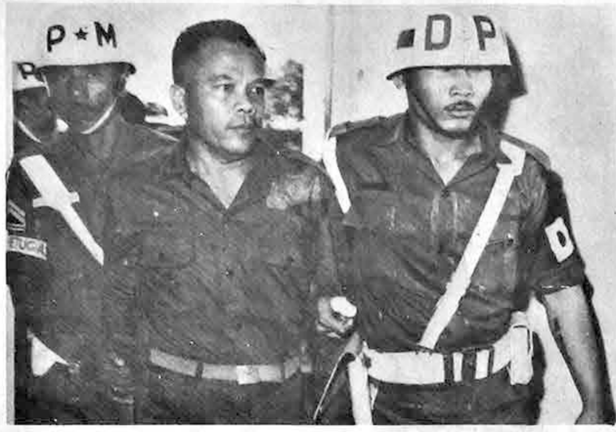
El ex-Tcnl. Untung, considerado como el jefe del fallido golpe de estado del primero de octubre último, en Indonesia, ha sido condenado a muerte por el tribunal militar especial, según anunció el martes por la mañana, la radio de Yakarta. Untung, que tiene 41 años, comandaba la guardia personal del Presidente Sukarno

Esta situación, por otra parte, ha determinado una tirantez de relaciones entre la Corte Electoral y el Poder Ejecutivo. Las insistentes demandas de la Corte respecto a la amnistía política, son también hechos que vienen deteriorando esas relaciones.