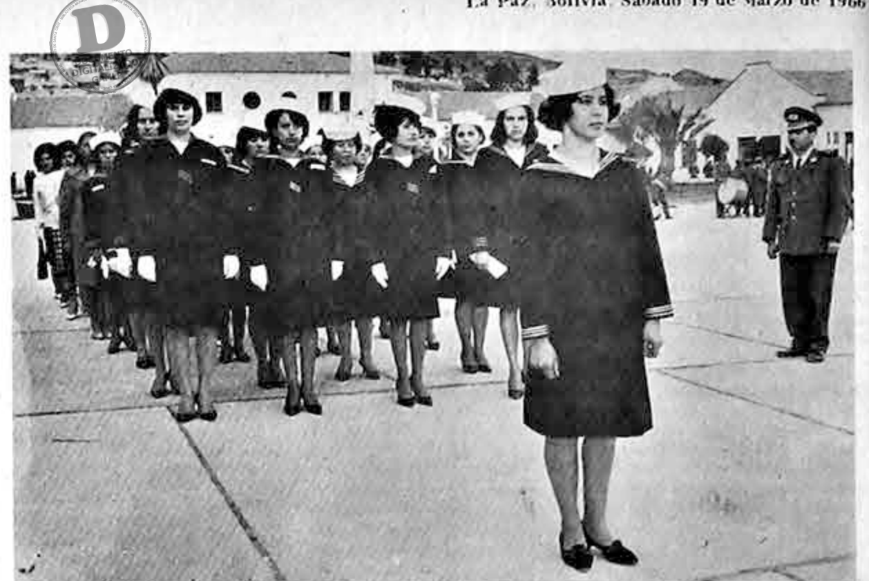
Grupo de señoritas con traje de marinero, que tendrá a su cargo la distribución de las escarapelas, como parte de la campaña "Un buque para Bolivia". La venta comienza mañana.

El programa de agasajos incluye el lunes una visita al Centro de Instrucción Militar del Perú, un almuerzo ofrecido en el Country Club de Villa por el Ministro de Guerra, General Italo Arbulu y una recepción en la Embajada de su país.