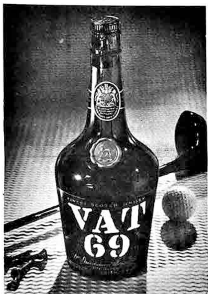
Atención de pedidos directos:

Turbina Dental, Rayos X. Edificio Almiraz, Yanacochy esq. Mercado 996. Tel. 25338 y 28123.