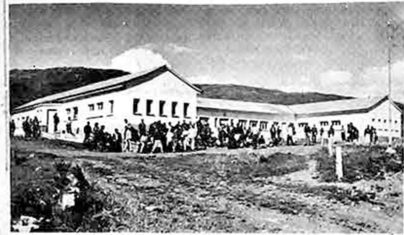
El Núcleo de Mejoramiento del Hogar cuenta actualmente con un moderno edificio de cinco cuerpos especialmente construido para cobijar a las 100 muchachas que asisten a los cursos regulares.