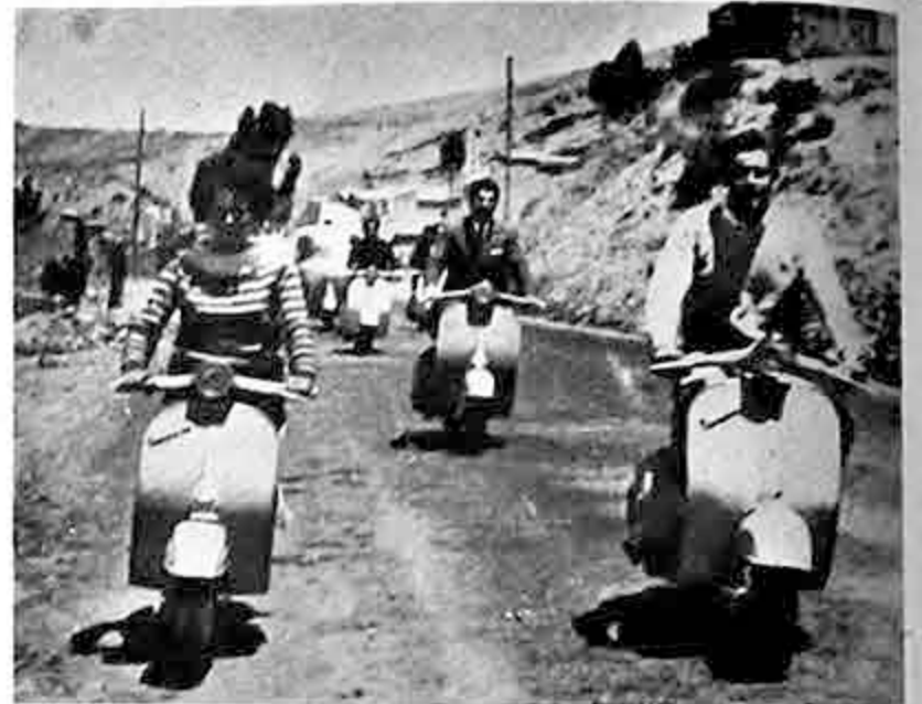
Las motonetas "Vespa" descendieron de esta manera por la carretera de "El Alto", para ingresar a nuestra ciudad en un desfile que concitó la atención del público el domingo último. Las motonetas "Vespa" fueron importadas por COBANA S.A., para contribuir en la solución de medios de transporte en nuestro medio, según expresaron personeros de la firma importadora.

sultados del Concilio Vaticano II y estarán presentes representantes de 214 Iglesias y comunidades protestantes.