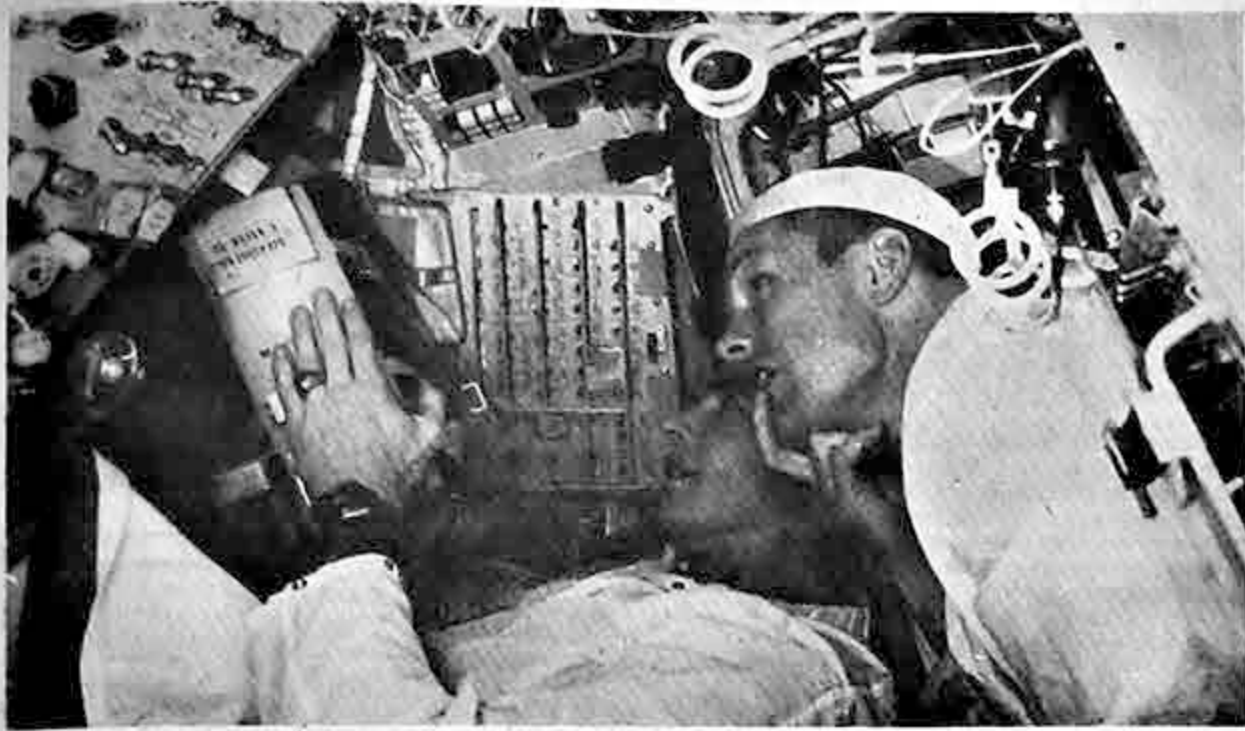
EN BUSCA DE "ESPACIO".- Los astronautas norteamericanos David Scott (izquierda) y Neil Armstrong buscan en el interior de su ya atestada nave espacial Gemini 8, descansando en la proa del cohete Titán II, en Cabo Kennedy, un lugar de almacenamiento adicional para objetos que necesitarán en su vuelo orbital.