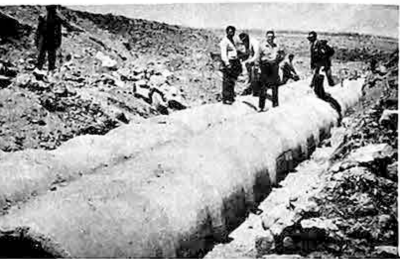
Técnicos del Servicio de Caminos durante una inspección de obras de arte en el Kilómetro 34.