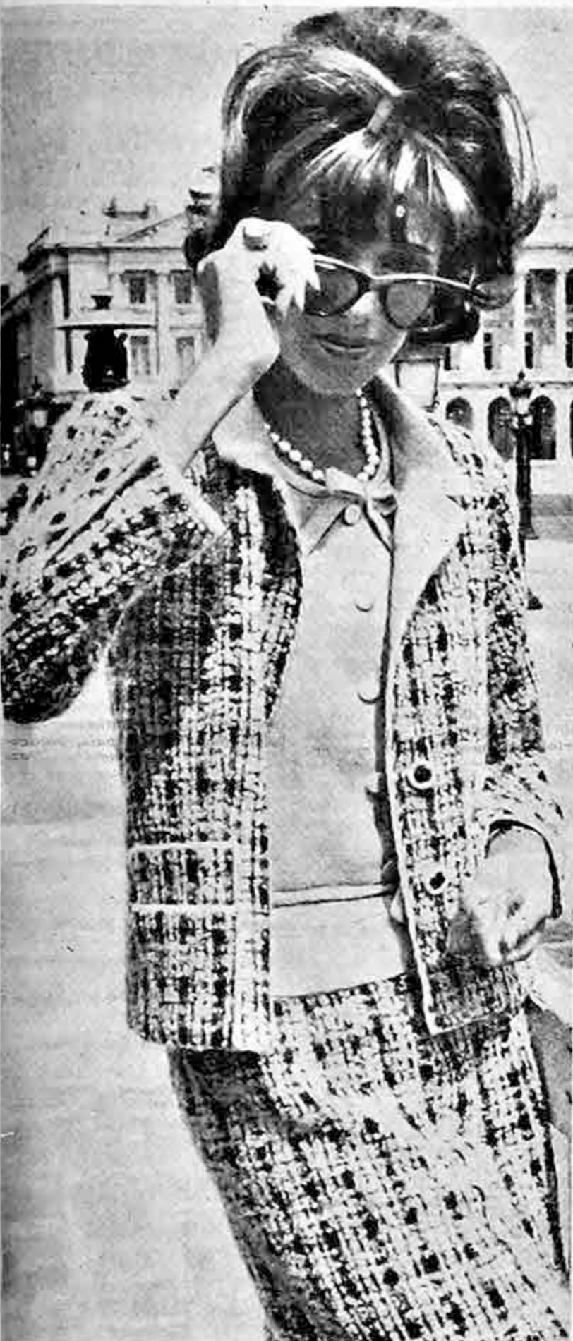
MODELO CHANEL Este precioso vestido está hecho de tweed azul y crema, la blusa está hecha de la misma tela que el forro del saco.