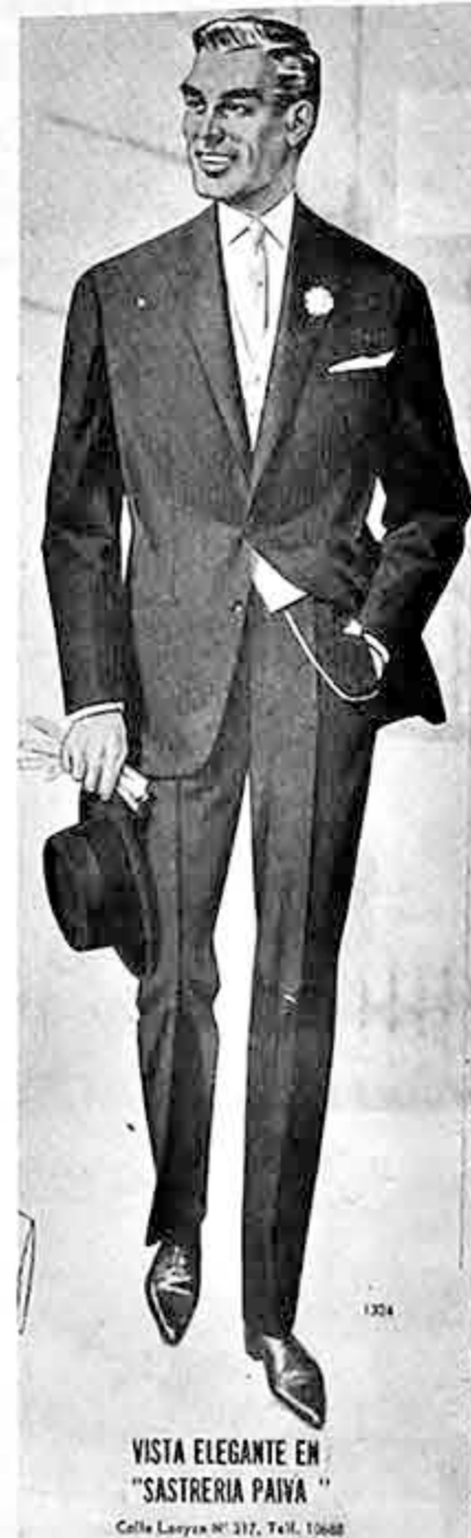
VISTA ELEGANTE EN "SASTRERIA PAIVA" Calle Laya Nº 317, Tel. 15488

Con expresiones de complacencia por la visita que realizaron durante dos días en nuestro país, los 41 miembros de la Junta Interamericana de Defensa partieron rumbo al Ecuador. En los dos días de permanencia en La Paz, los militares del continente desarrollaron intensa actividad en compañía de los Jefes de las FF.AA. bolivianas.