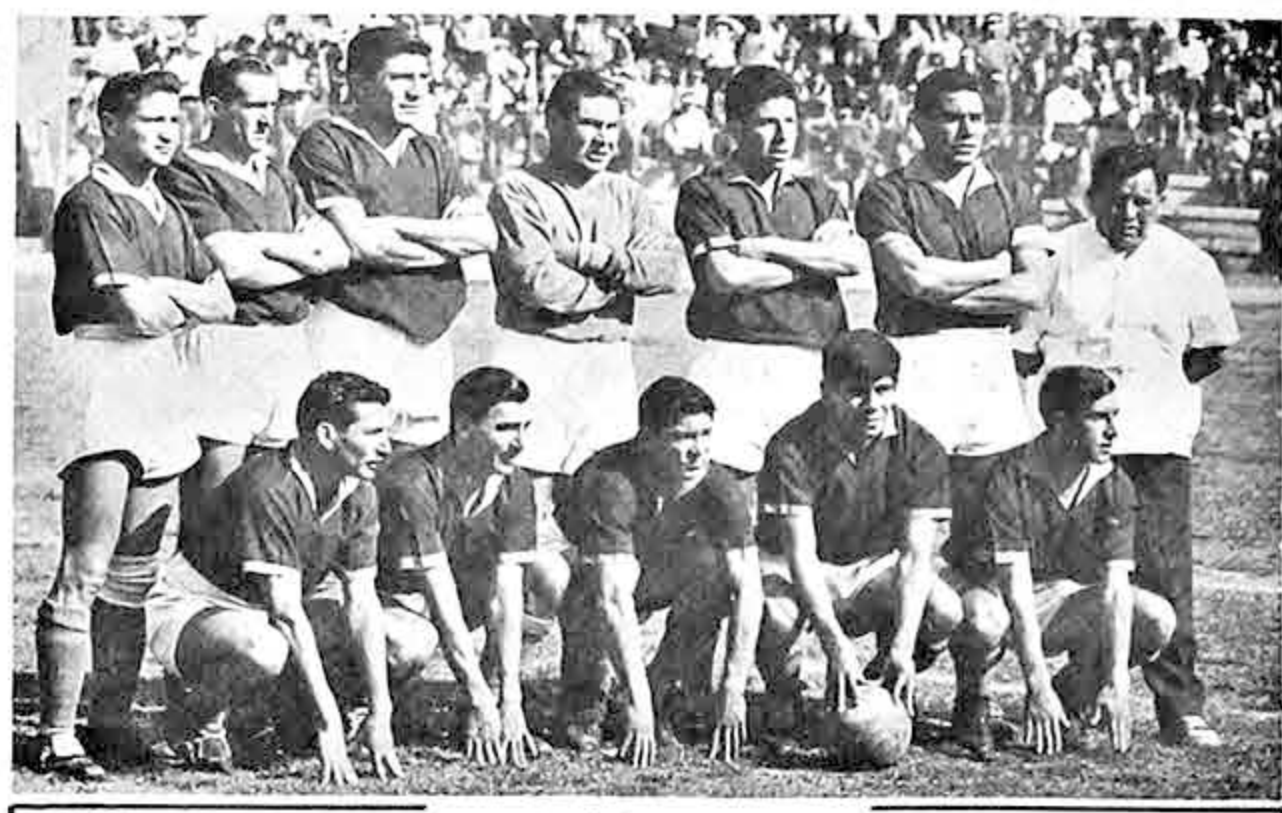
BUSCAN REHABILITARSE.- Integrantes del campeón nacional de fútbol, Municipal, que esta noche ingresarán al gramado miraflorentino en busca de performance rehabilitadora y dos puntos, frente a Emelec de Ecuador.