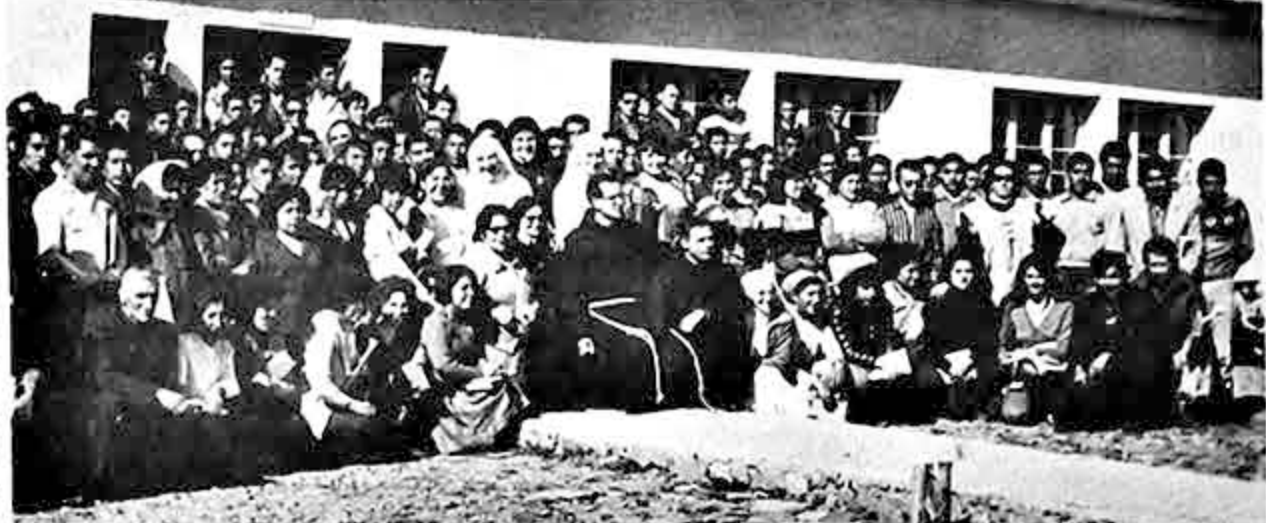
Los maestros que asisten al cursillo en Korpa, población a 105 kilómetros de La Paz, están con autorización del Ministerio de AA.CC. para postergar en sus centros la inauguración del año lectivo. Aparte de capacitar a los cursillistas, en Korpa se logra el conocimiento mutuo entre todos ellos.

Hogar cuenta actualmente con un edificio de cinco cuerpos que podrá cobijar a cien muchachas campesinas de 14 a 20 años. El reducido grupo de religiosas y maestras que atienden el núcleo ha logrado dotarlo de todas las dependencias que hacen de él un verdadero hogar donde las campesinas aprenderán a desenvolverse utilizando las normas de higiene, alimentación y atención de su hogar de la gente de las ciudades.