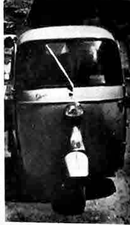
Conjuntamente con las motonetas "Vespa" llegaron también los llamados "Motocarros" de la misma marca. Los motocarros "Vespa" tienen una capacidad para transportar hasta 400 kilos de carga y en el cual pueden viajar cómodamente 6 personas incluyendo al conductor. Tanto las motonetas como los motocarros están especialmente fabricados para nuestro país, particularmente para la ciudad de La Paz. COBANA S.A., importadores de estos pequeños vehículos, tiene su salón de exposición en la Av. Mariscal Santa Cruz de esta ciudad y en sus sucursales del interior.

Cuando preguntamos si los precios de las motonetas "Vespa" habrían de ser igual que las motocicletas, nos dijeron que no. "El precio de estos pequeños vehículos será inferior al de las motocicletas, no obstante de que las "Vespa" son superiores en calidad y rendimiento".