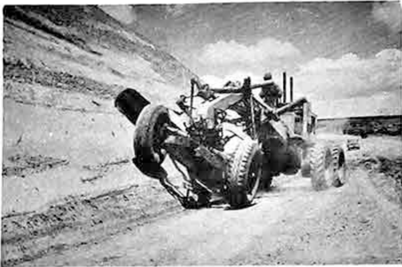
Una motoniveladora del Servicio Nacional de Caminos trabajando en un corte en la ruta del Km. 31. Es de mucha responsabilidad el trabajo que esta empresa esta realizando.

ciada por USAID/ y el S.N.C. realiza el trabajo como contratista. Una Compañía Norteamericana realiza actualmente los estudios de factibilidad en el tramo existente entre los 10 kms. asfaltados en Oruro y los 34 kms. que se asfaltarán desde La Paz.