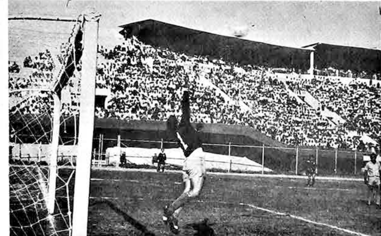
DETIENE ORDEÑANA.- El guardavalla de Emelec se apresta a controlar un balón que cae por elevación sobre su valla. Los ecuatorianos actúan esta noche en el field del estadio Siles

Los directivos universitarios anunciaron por otra parte, que es posible que su primer equipo de fútbol viaje a la ciudad de Arequipa para jugar una serie de encuentros, con el auspicio del Melgar de la ciudad mistiana.