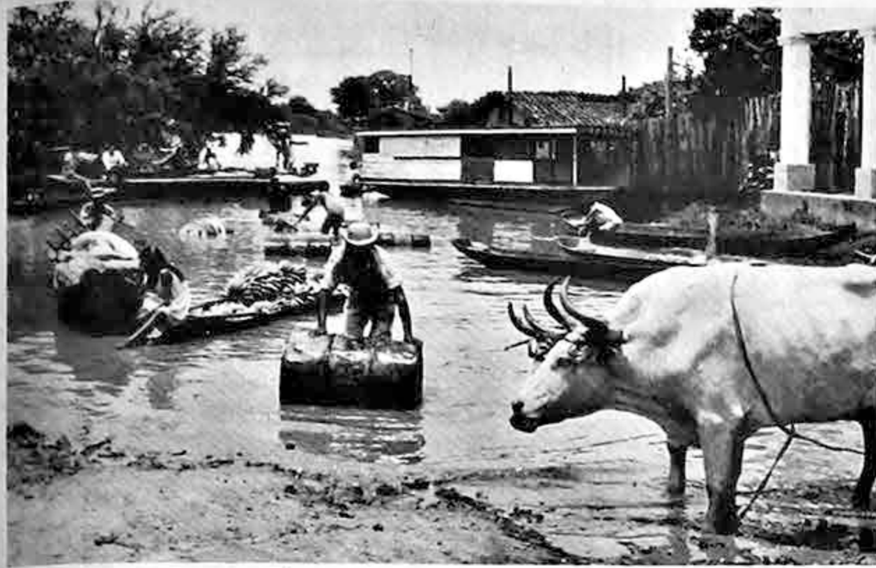
El transporte de auxilio para las familias que se encuentran asediadas por las aguas alejadas de Trinidad es ahora uno de los principales problemas en el Beni. Carretones tirados por bueyes y rústicas canoas cumplen esa misión en condiciones difíciles.