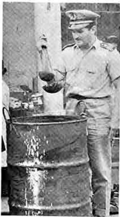
El sistema de comida en olla común ha causado descontento en los damnificados. En la foto, una autoridad aparece junto a una olla común. Ahora se cambiará el sistema por otro de reparto de viveres a grupos de cinco familias.

Esta actitud ha causado gran preocupación en la Fiscalía del Distrito. Se espera para hoy día que el Ejecutivo nombre a los nuevos magistrados y jueces del distrito judicial de La Paz.