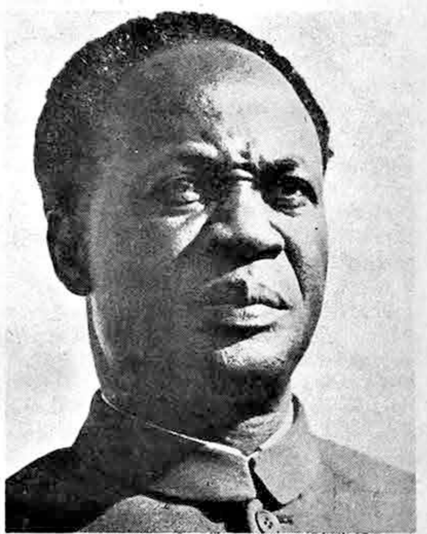
Kwame N'krumah salió de Ghana como Presidente para realizar una visita a Pekín y Hanoi. Ya no podrá volver a su país, pues un golpe militar lo derrocó. (Amplia información página 2)

Venezuela introducirá probablemente la cuestión de la aplicación del artículo 5 de la Carta sobre el ejercicio de la democracia representativa algo que dividiría a la conferencia entre gobiernos legales y aquellos con regímenes de facto. Los Estados Unidos se encuentran en el medio de esta división. Se espera que Chile presente otro tipo de ideas. Si prosperara la iniciativa norteamericana para dar más poderes al Consejo, Chile podría pedir que se lo situara en alguna capital latinoamericana. No obstante las declaraciones oficiales en sentido contrario, se cree que Chile desea balancear las influencias dentro de la OEA, modelándola como las Naciones Unidas. Dentro del plan chileno de "descentralización" la Conferencia Interamericana de Cancilleres se reunirá anualmente para decidir el presupuesto y política de la OEA.