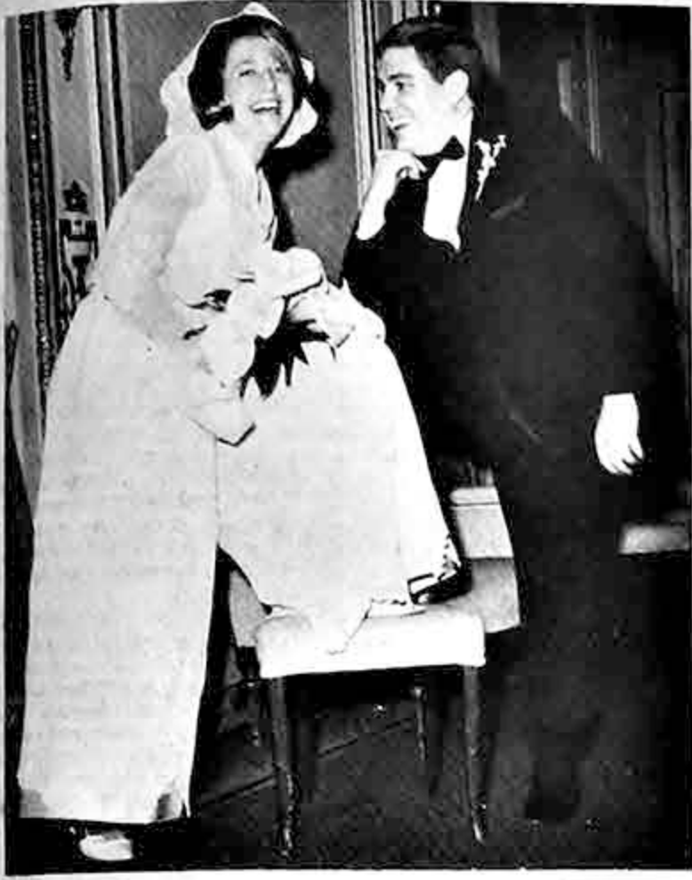
El grabado muestra una nueva modalidad en el traje de novia que lleva esta modelo en base unos "slacks" o pantalones que abrevian el trousseau nupcial. La modelo posa para su entusiasmado esposo y los fotógrafos.