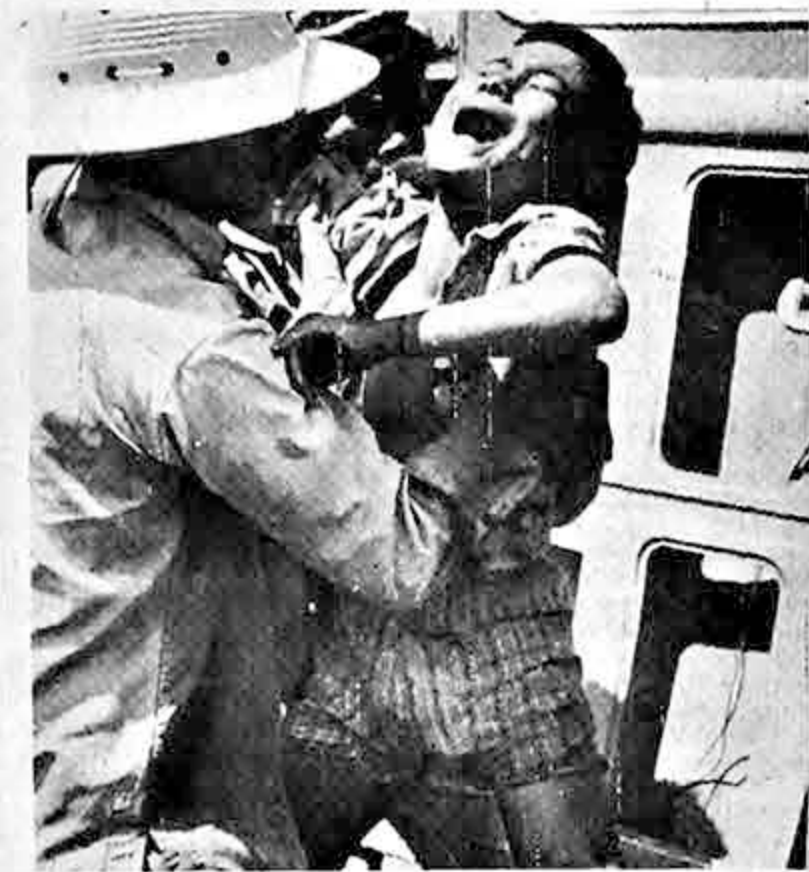
Un adolescente vietnamés lloró mientras es llevado a un puesto de urgencia en Saigón. Fue una de las víctimas de los atentados terroristas realizados cerca del aeropuerto de Saigón, y que produjeron 12 muertos vietnemeses y 60 heridos. El joven se había ocultado dentro de un negocio después de que explotaron las bombas.

Las relaciones entre la empresa y los trabajadores pueden ser