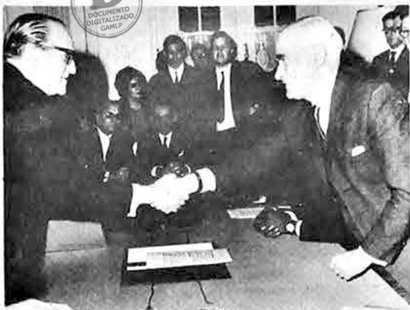
Los ministros de Relaciones Exteriores Ignacio Iribarren Borges (Izq.) de Venezuela, y Michael Steward, de Inglaterra, se estrechan la mano después de firmar, el 17 de febrero, en Ginebra, el acuerdo entre sus países para resolver el conflicto sobre las fronteras de la Guayana Británica.

Huancayo, Perú, 24 (AP). - Un gigantesco aluvión sepultó a siete personas ayer en Bajo Yurinaque, cerca de San Ramón. El aluvión se produjo por las recientes lluvias. San Ramón está a unos 300 kilómetros al este de Lima.