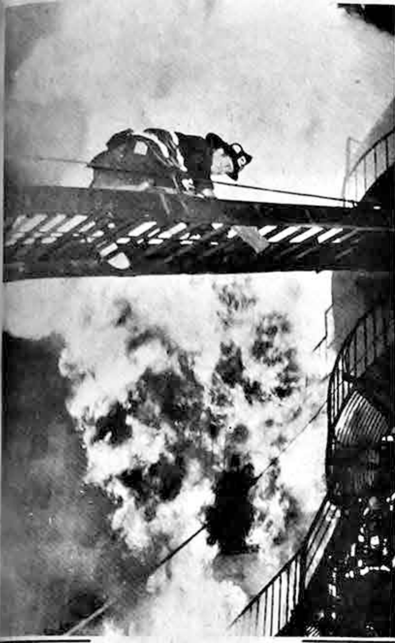
Un bombero asciende por escaleras a un edificio de Boston que se incendió el 20 de febrero. Fueron salvadas numerosas personas que vivían en el edificio, incluyendo una pareja de gemelos de 10 años de edad.