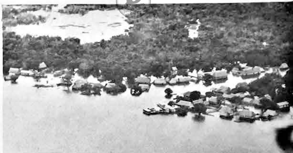
Una vista parcial de la zona sur de Trinidad, donde se puede observar la creciente de aguas, que han llegado a inundar numerosas propiedades, afectando principalmente a las poblaciones de San Javier, Loreto y Camiaco.

El pueblo beniano ha formulado un pedido a las autoridades del Gobierno a fin de que se comine a YPFB continuar con el abastecimiento de carburantes, para su expendio a precio bajo, distribuido por la Alcaldía para evitar especulaciones. Se indicó que la primera partida de carburantes que llevó YPFB en sus tres aviones ya se agotó, siendo por consiguiente necesario que YPFB continúe con estos envíos, por considerarse de urgente necesidad para los 2.500 evacuados de las zonas aledañas a Trinidad.