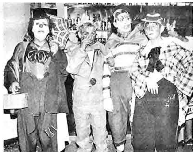
MASCARADA DEL CLUB DE LEONES.- Contornos salientes tuvo la mascarada que organizaron los socios del Club de Leones en los salones del Círculo Italiano celebrando las fiestas del Carnaval. En la foto un aspecto de la reunión.

Colón 282 - Edif. Cía. Bna. Seguros - Casilla 1053 - Cobles; IBERAIR La Paz - Bolivia