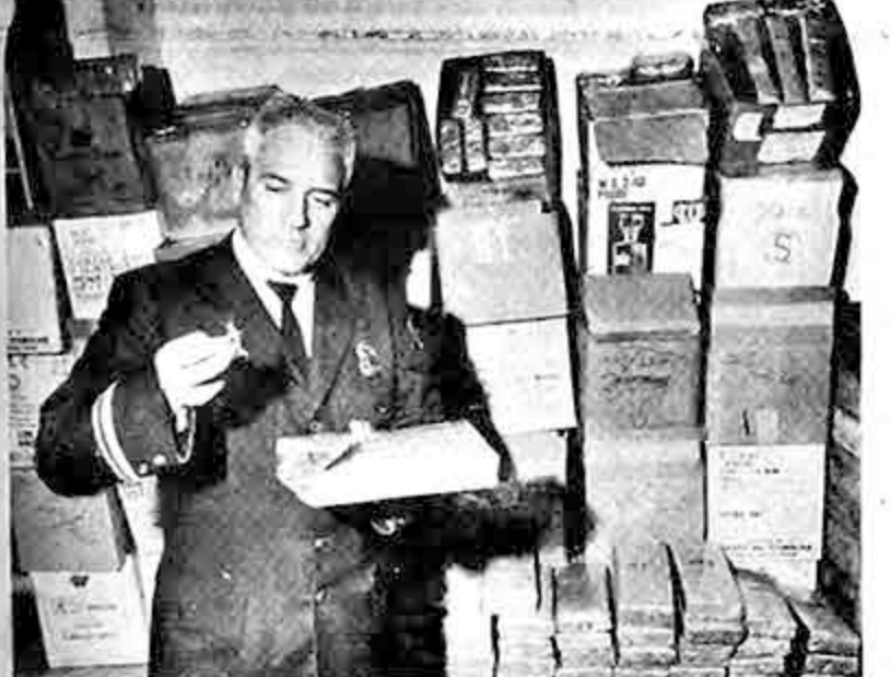
Un inspector de aduana de Los Angeles, California, posa ante un cargamento de más de media tonelada de marihuana, que fue decomisada recientemente. Se calcula que la marihuana tenía un precio mayor a los 600.000 dólares en el mercado ilegal y que constituye el mayor decomiso realizado de un solo golpe.