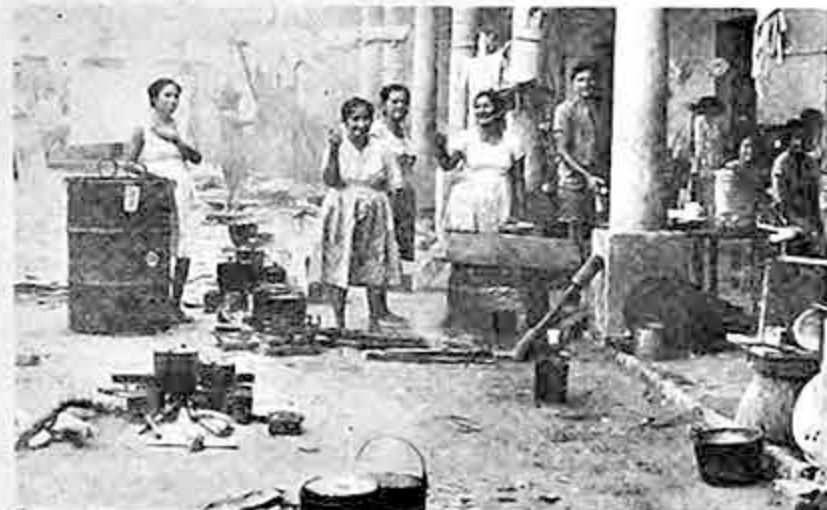
Amas de casa en la Escuela 6 de Agosto de Trinidad, han escogido el patio principal de dicho establecimiento para improvisar cocinas a base de leña. En dicho local están albergadas cerca de 630 personas entre mujeres, niños y adultos.