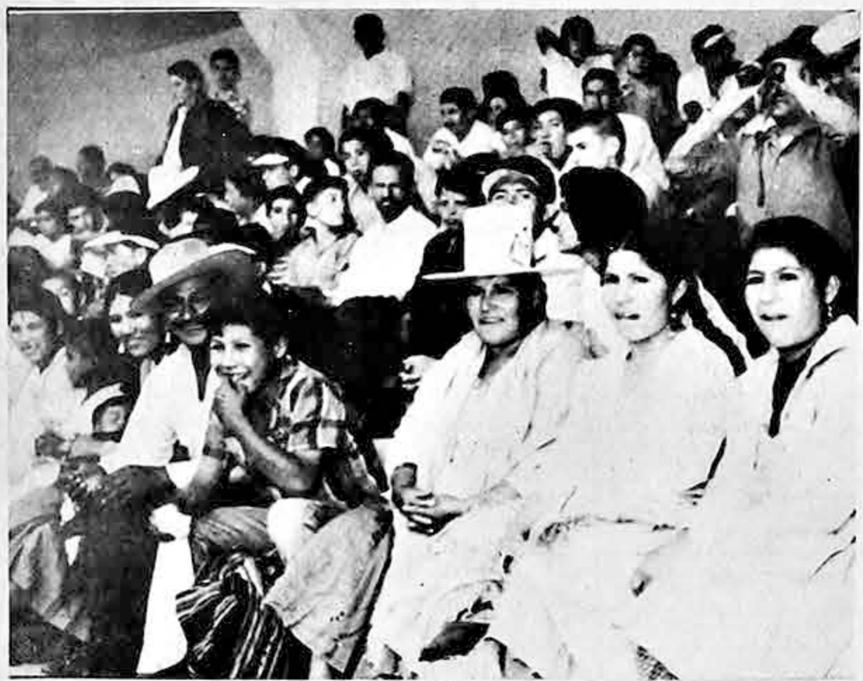
DAMAS EN EL FUTBOL.- El valle en pleno en las graderías del estadio Félix Capriles de la ciudad de Cochabamba. Ni Nacional ni Wilsterman justificaron el viaje de estas representantes vallunas a la ciudad en busca de buen fútbol. Seguramente tuvieron que conformarse con chicha.