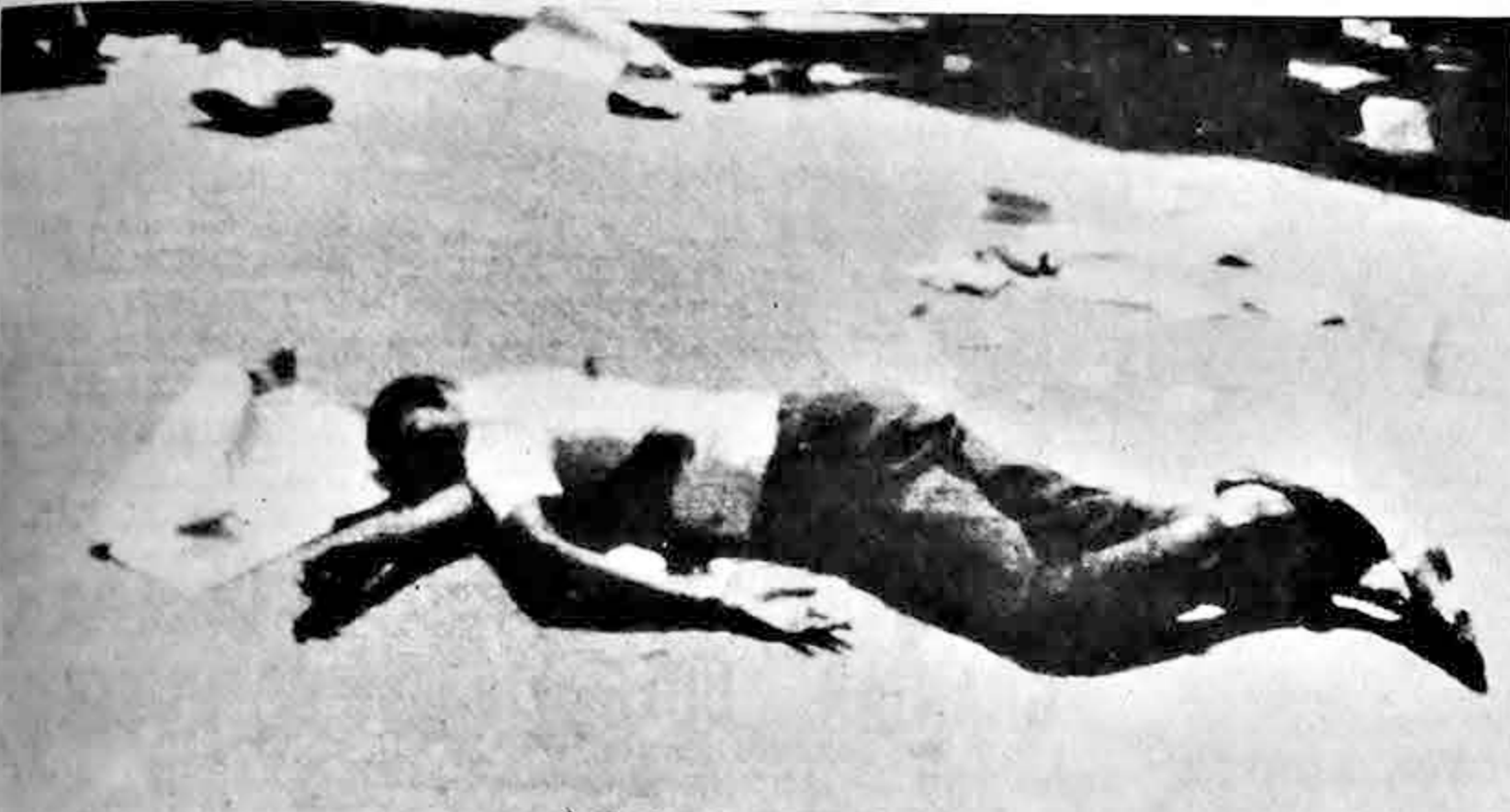
Este es el cadáver de uno de los civiles que cayó víctima de la prolongada violencia en Santo Domingo. La acción de los francotiradores está dando a la lucha un cariz de nueva guerra civil. En la represión de los brotes armados participa ya activamente la Fuerza Interamericana de Paz