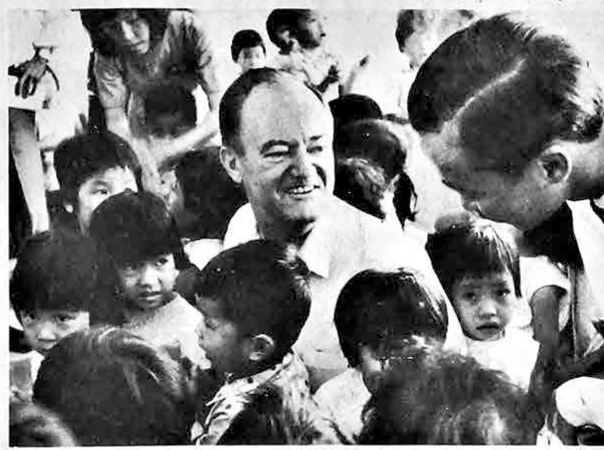
El Vice Presidente de los EE.UU., Hubert Humphrey conversa con Nguyen Cao Ky, Premier de Viet Nam mientras los rodean unos niños durante una visita a un kindergarten en Phyl Hoa, a unas cuantas millas de Saigón. Los gobernantes realizaban una visita de cuatro horas a diversos proyectos de índole económica y social

partido con diferentes corrientes de opinión, y dice: "La gran contribución de Betancourt es que ha demostrado que el personalismo no es la cuestión clave en la transformación política latinoamericana. Paz demostró también muy bien los peligros de basar un movimiento revolucionario en un solo hombre".