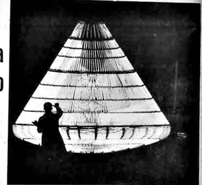
GENTELEANTE PRUEBA DE SEGURIDAD.- El calor radiante de un brillante resplandor a la atmósfera del Módulo Apolo, la cápsula que llevará a los astronautas norteamericanos en su proyectado vuelo a la Luna. Durante el vuelo, la atmósfera deberá soportar, simultáneamente formidable calor por un lado e intenso frío en el otro. Esta prueba de la resistencia del metal se efectúa en condiciones simuladas semejantes a las existentes en el espacio.

Para salir de esta situación Aldo Moro dispone hasta mañana martes por la tarde. Fecha que le fue fijada por el presidente de la república, Giuseppe Saragat, al confiarle la nueva misión de información, el pasado viernes por la tarde.