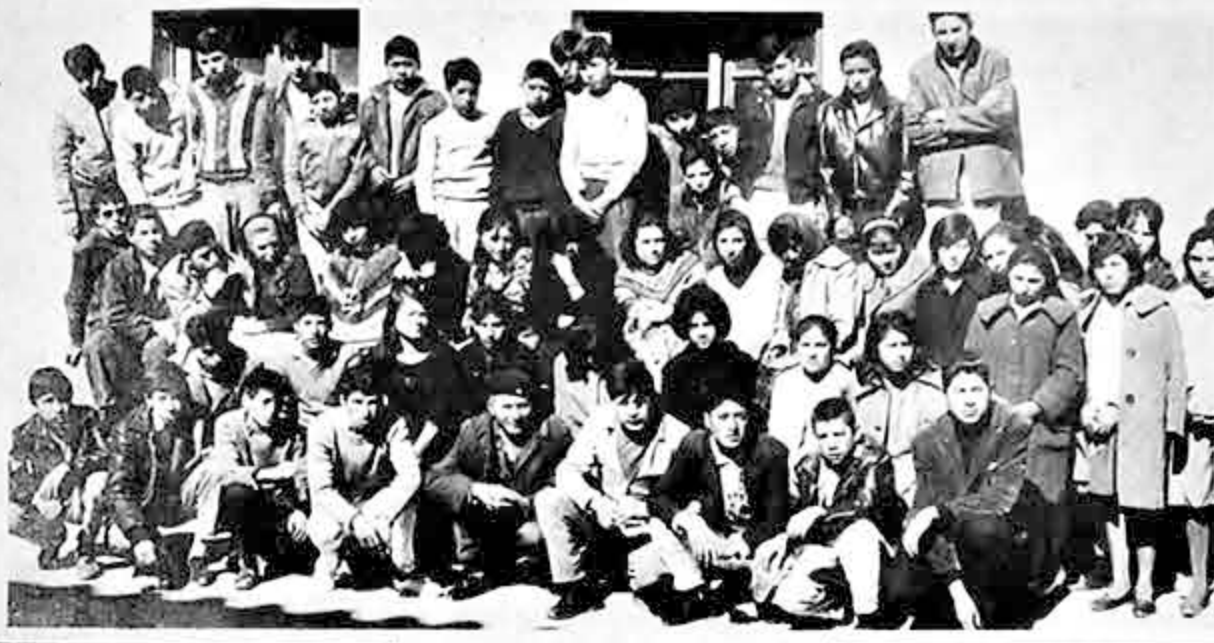
Estos son los estudiantes potosinos que se aplazaron en exámenes de desquite. Ante la negativa de las autoridades para rendir el re-desquite, se declararon en huelga de hambre. Los huelguistas en su mayoría son alumnos que descuidaron sus responsabilidades de estudiante. Muchos padres de familia apoyan a los huelguistas, en cambio otros que reconocen la incapacidad de sus hijos al no haber podido vencer un segundo examen final, rechazan esta clase de presiones y hacen suya esta sentencia: "Lo que la naturaleza no da, Salamanca no lo presta". (Foto Cima).