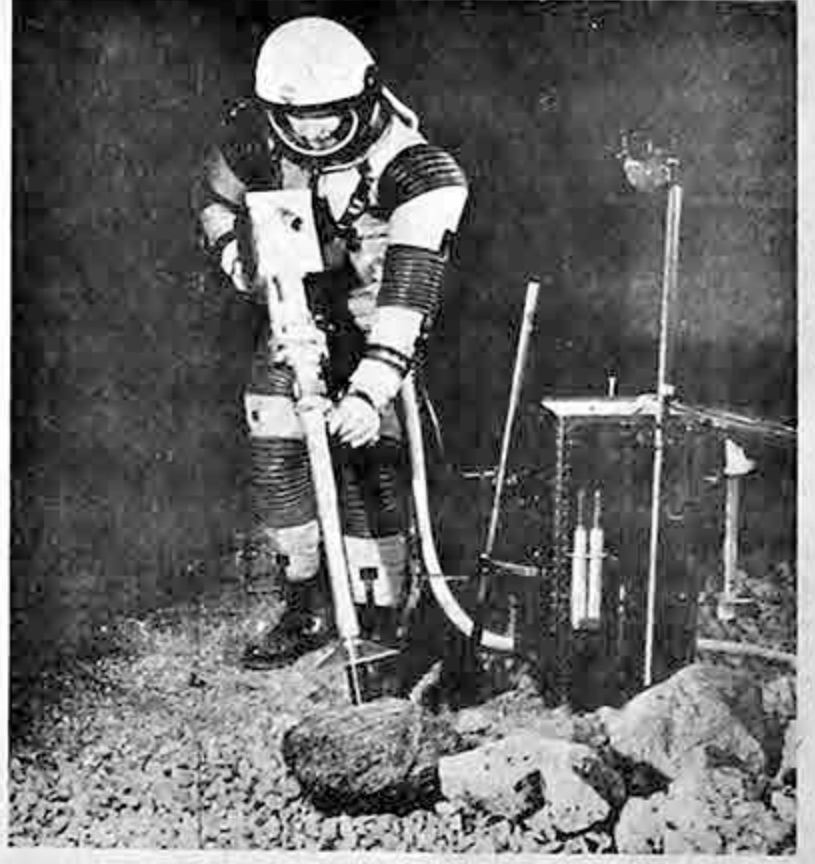
Este taladro que funciona a base de pilas es uno de los que ha fabricado la Martin Co. para el uso de los astronautas norteamericanos cuando lleguen a la Luna. El taladro podrá ser usado para agujerear o remover cualquier materia rocosa sin importar su dureza

esto formó parte de la formula de pacificación acordada en agosto pasado. Las autoridades militares habían advertido reiteradamente que gran número de armas seguían en poder de los elementos rebeldes. Se dice que los francotiradores también están bien provistos de granadas de mano.