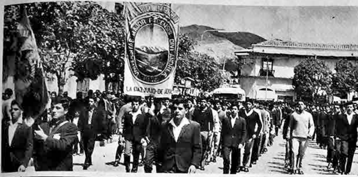
Alumnos del Colegio Nacional "Ayacucho" desfilan frente al Palacio de Gobierno, durante el recorrido que hicieron los estudiantes por diversas calles de la ciudad, después de haber participado en el acto cívico que se llevó a cabo en la plaza Antofagasta.