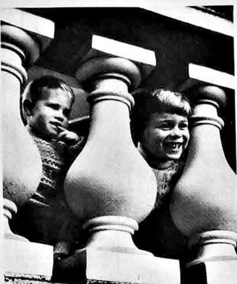
El Príncipe Andrés de Inglaterra (derecha), que cumplirá 6 años el 19 de Febrero, y su hermano de dos años, Príncipe Eduardo, observan a través de una balaustrada en su hogar del Buckingham Palace

El Comando Norteamericano resolvió hoy ampliar sus búsquedas en otras zonas. Varios millares de hombres, centenares de técnicos, un crucero, diecisiete navíos de todo tipo, dos submarinos de bolsillo, escuadrillas de helicópteros y grupos de hombres-rana emprenden una nueva y minuciosa exploración palmo a palmo. Todos tratan de localizar el artefacto nuclear y la caja negra que, pese a las consignas oficiales de silencio, nadie tiene idea de su paradero, ni siquiera aproximado. Al parecer, ambos objetos pueden hallarse lo mismo en tierra firme que en el mar.