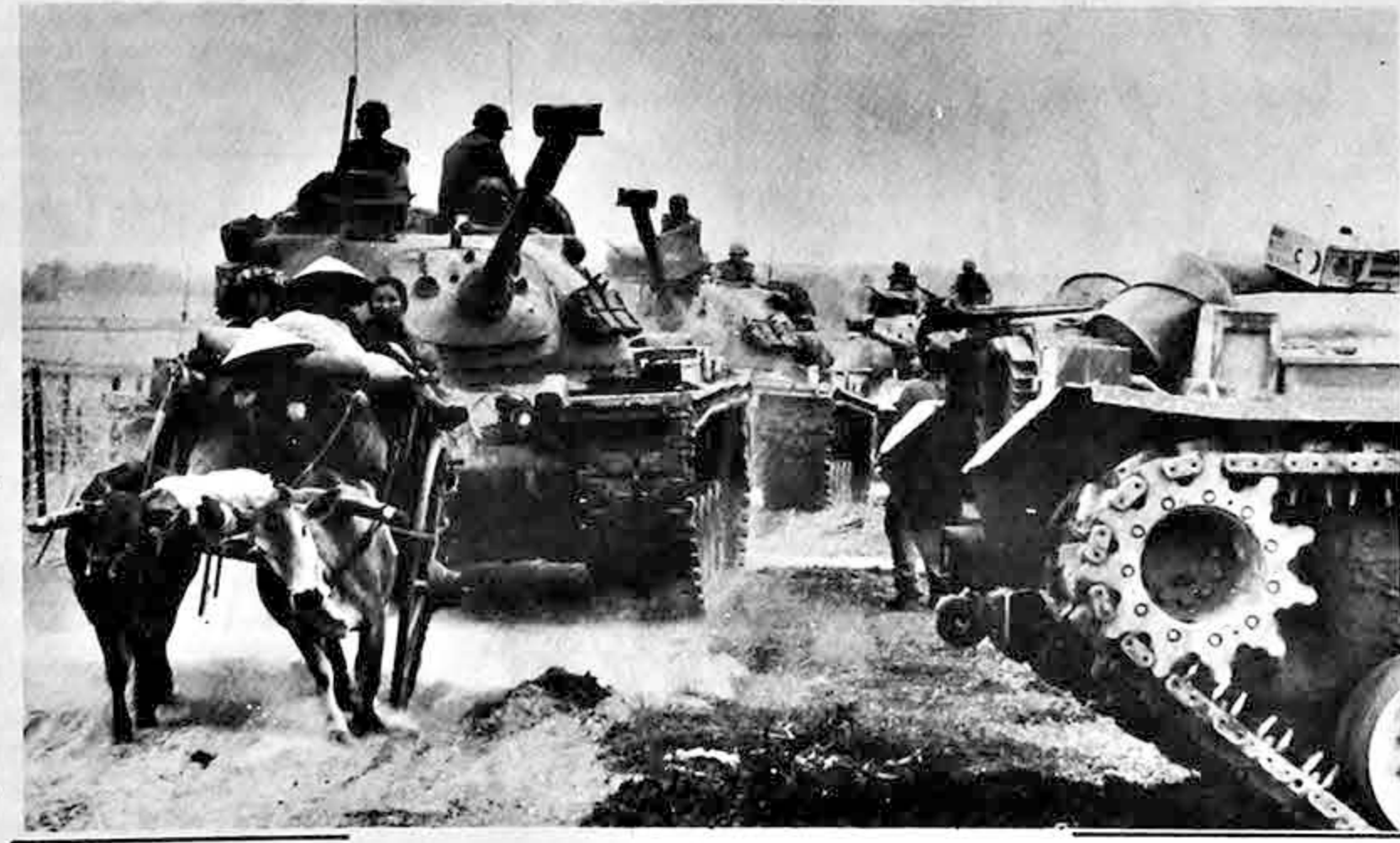
Bueyes y campesinos vietnamitas son seguidos por tanques norteamericanos, cerca de Trung. Los campesinos huyen con todas sus pertenencias, mientras los tanques iban a reforzar a un batallón norteamericano de infantería que combatía en las inmediaciones