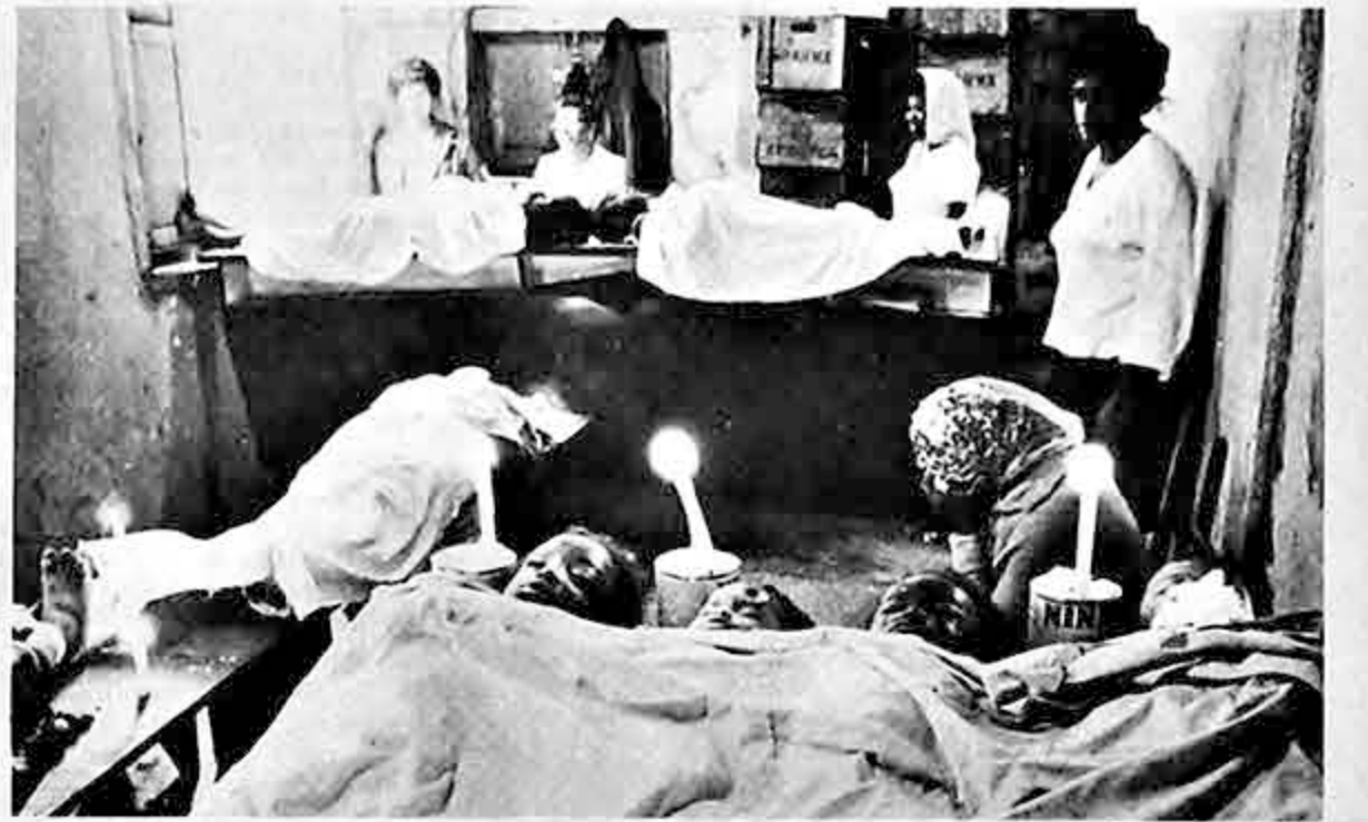
Varios niños yacen en la morgue improvisada del Morro do Pavão en Río de Janeiro. Son parte de los centenares de víctimas producidas por los deslizamientos y las inundaciones en aquella ciudad.