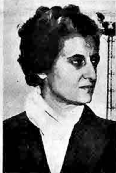
INDIRA GANDHI, nueva premier de la India.

Muchos se arrodillaron y besaron los zapatos de la jefa de la nación. Una señora canosa puso un billete de una rupia (21 centavos de dólar) en la mano de la señora de Gandhi.