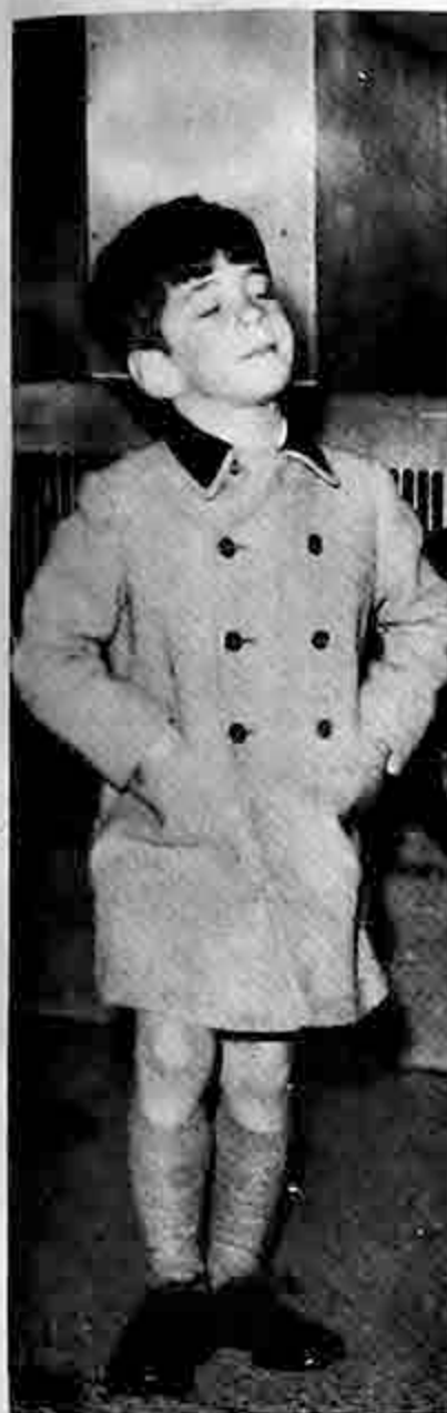
Los reflejos de los flash de los fotógrafos crean un halo alrededor de la cabeza de John Kennedy hijo, mientras éste sigue a su madre para embarcarse, en el aeródromo Presidente Kennedy de Nueva York, en el avión que los conduciría a Europa, donde actualmente la familia pasa unas vacaciones