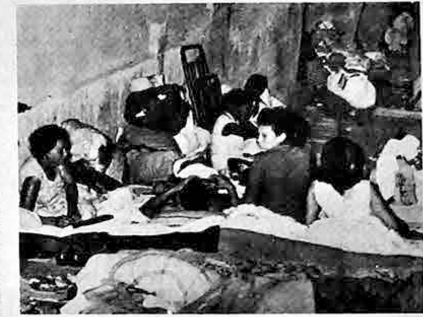
Numerosos refugiados cariocas, provenientes de las zonas azotadas por desastres, descansan en el centro comercial de Copacabana, todavía no concluido