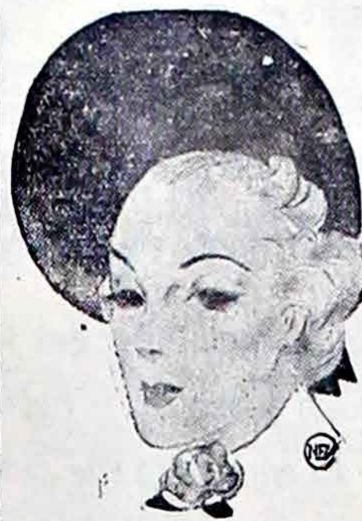
UNO DE LOS POPULARES SOMBRERITOS TIPO HALO, MUY ENTADOR PARA CIERTOS TIPOS DE PEINADO.