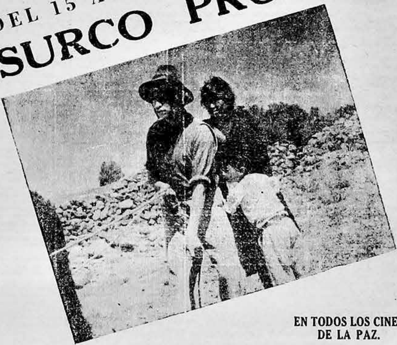
EN TODOS LOS CINES DE LA PAZ.

PRESENTA: DEL 15 AL 21 DE JUNIO "SURCO PROPIO"