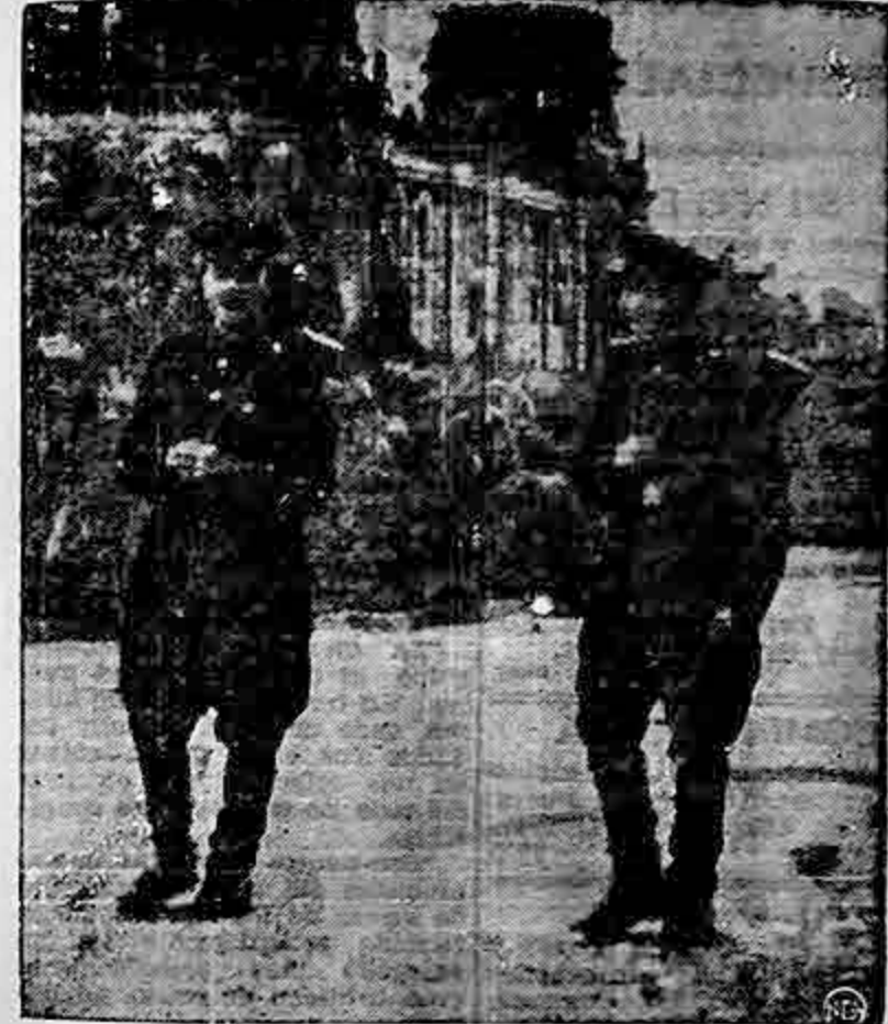
ESTA FOTOGRAFIA DE DOS POLICIAS COMUNISTAS QUE fué tomada en el sector rojo de Berlín dio lugar a que fueran detenidos el corresponsal de la United Press, W. R. Higginbotham y cuatro periodistas norteamericanos los que fueron llevados a una comisaría. Todos ellos estuvieron detenidos 15 minutos y luego fueron puestos en libertad por los comunistas quienes permitieron a Higginbotham que conservara su cámara y película.