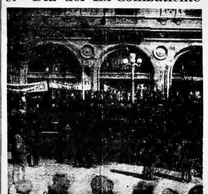
CONCENTRACION DE EXCOMBATIENTES EN LA PUERTA de la Estación Central.