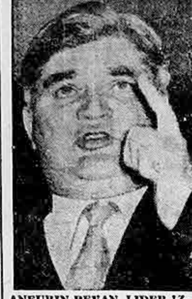
ANEURIN BEVAN, LIDER IZQUIERDISTA BRITANICO.