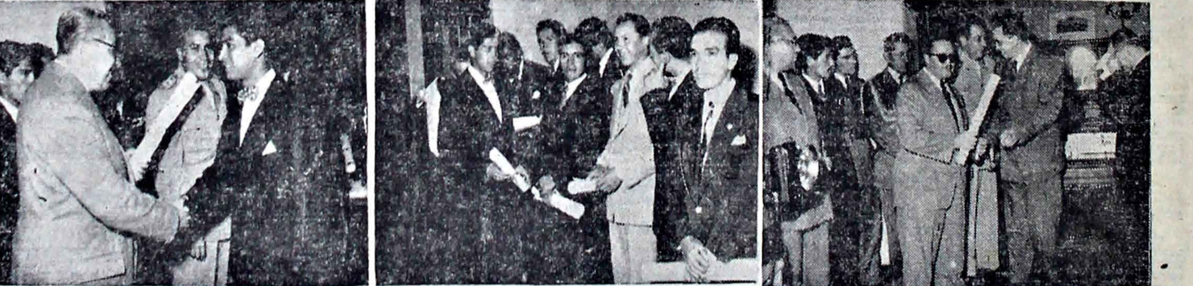
EL EMBAJADOR DE LOS ESTADOS UNIDOS DE VENEZUELA, DOCTOR ARBELLO TORREALBA, HIZO ENTREGA EL MARTES PROXIMO PASADO, DE ARTISTICOS DIPLOMAS A NUESTROS representantes en los Terceros Juegos Deportivos Bolivarianos realizados en Caracas. Nuestro reportér gráfico captó estos a spectos de la agradable reunión.